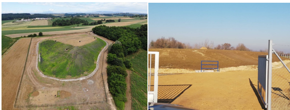
Slika 2.: Sanirana odlagališta otpada Trema – Gmanje i Hintov