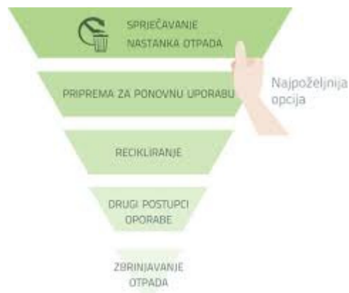
Slika 1.:Red prvenstva gospodarenja otpadom: