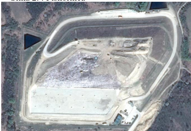
Slika 2. : Piškornica

Procjedne vode iz odlagališta sakupljaju se u vodonepropusnim sabirnim bazenima (lagunama) iz kojih se vrši recirkulacija u tijelo odlagališta.