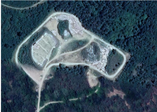
Slika 3. Peski - Đurđevac