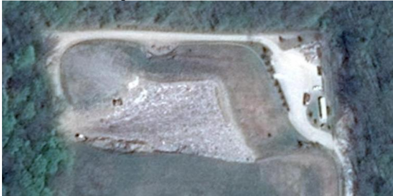
Slika 1. : Ortofoto prikaz „Ivančino brdo“, Križevci