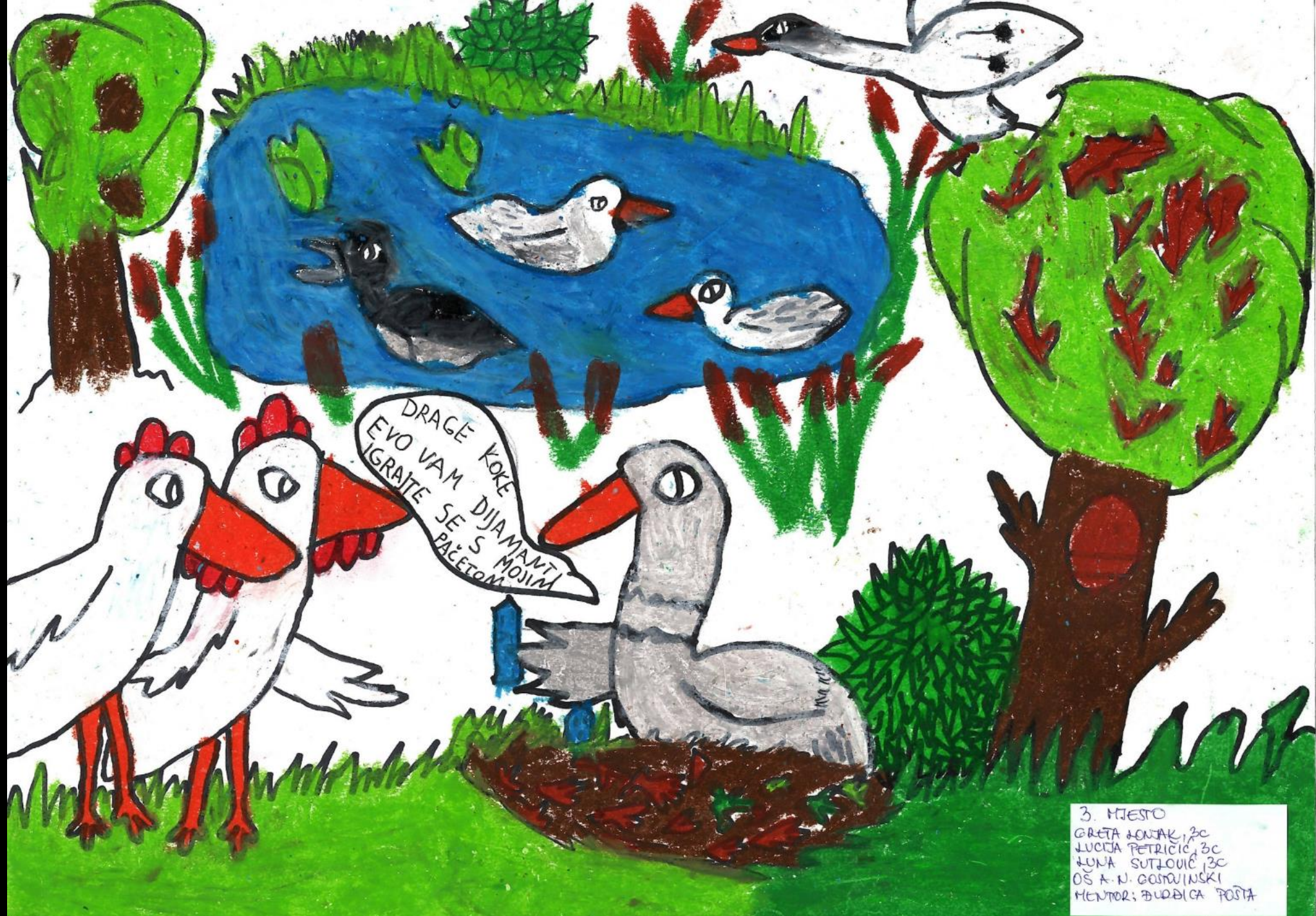
3. Mjesto GRETA LONJAK, 3C LUCIJA PETRICIĆ, 3C LUNA SUTLOVIĆ, 3C OŠ A. N. GOSWIŃSKI MENTOR: BUDICA POSTA