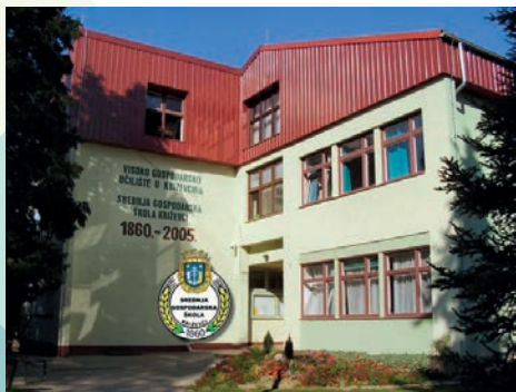
Ulaz u zgradu Srednje gospodarske škole Križevci