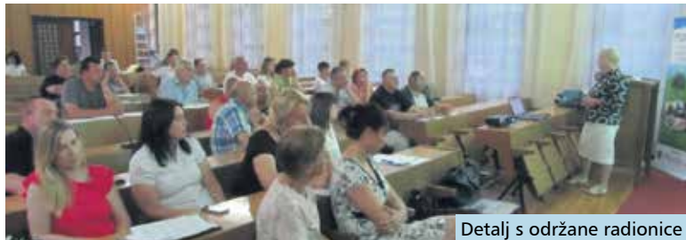
Detalji s održane radionice

U okviru Programa ruralnog razvoja 2014. - 2020. ovih dana aktualan je natječaj za Mjeru 6.3.1. koja omogućuje razvoj malih poljoprivrednih gospodarstava. S iznosom od 15 tisuća eura, koliko je navedenom Mjerom moguće ostvariti, prihvatljiva je kupnja zemljišta, nabava opreme, mehanizacije i strojeva, podizanje višegodišnjih nasada i stjecanje stručnih znanja, kao i potpora operativnom poslovanju obiteljskih poljoprivrednih gospodarstava.