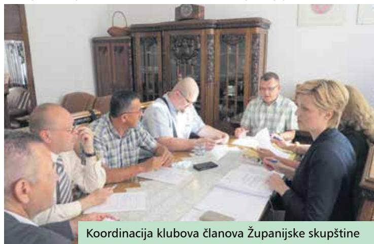
Koordinacija klubova članova Županijske skupštine

S ciljem povećanja transparentnosti i otvorenosti sustava županijske uprave donesen je Kodeks savjetovanja sa zainteresiranom javnošću koji omogućava da građani aktivno sudjeluju u kreiranju pojedinih akata Županije o kojima će u konačnici Županijska skupština donijeti odluku. Jačanju daljnje otvorenosti zasi-