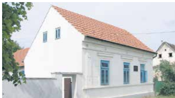
Odobren projekt rekonstrukcije i nadogradnje objekta Kuća Krste Hegedušića u Hlebinama

Ministarstvo regionalnoga razvoja i fondova EU-a objavilo je popis projekata odabranih za sufinanciranje u 2015. godini po Programu održivog razvoja lokalne zajednice za 2015. godinu. Ministarstvo je u skladu s indeksom razvijenosti izvršilo alokaciju