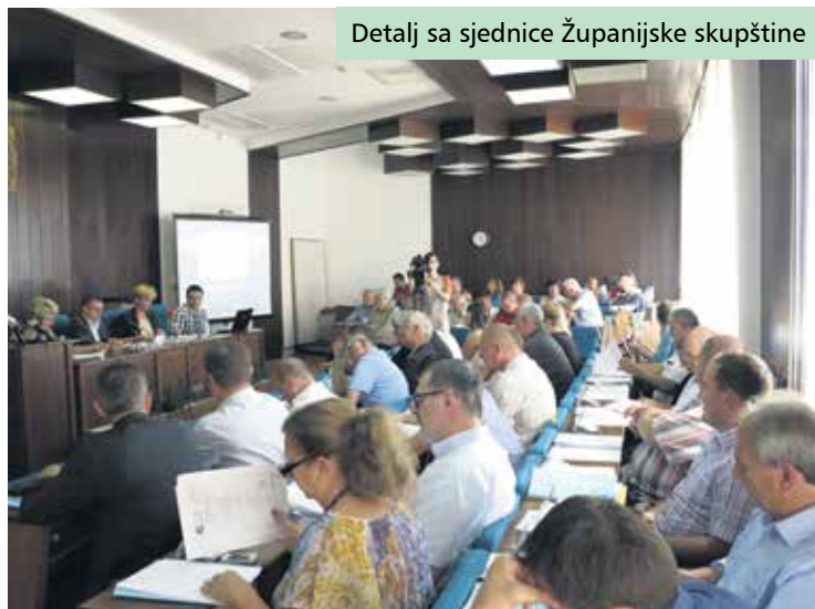
Detalj sa sjednice Županijske skupštine

društvima u kojima Županija ima poslovne udjele ili dionice (Piškornica, Geopodravina i drugi). Izvješća su dala i posebna radna tijela Županijske skupštine (Županijski savjet mladih, Povjerenstvo za ravnopravnost spolova, Savjet za razvoj civilnog društva i dr.). Svoja izvješća podnijela je i nadležna Policijska uprava koprivničko-križevačka, kao i Zavod za zapošljavanje, Područna služba Križevci.