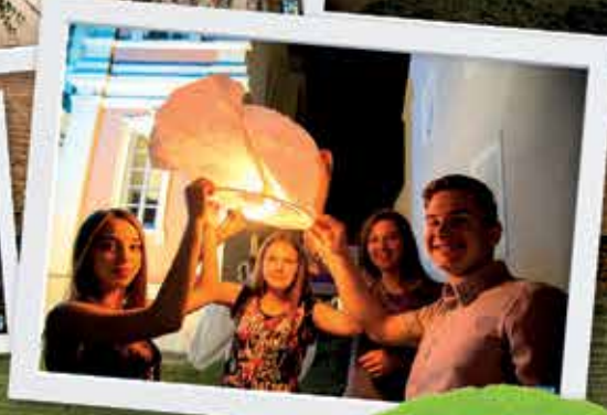
21. Podravski motivi u Koprivnici 19. - 21. lipnja