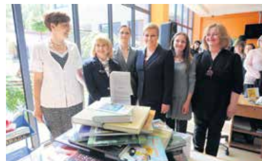
Predsjednica Republike Hrvatske gđa. Kolinda Grabar Kitarović u društvu knjižničarki

- 100 mještana se u njega učlanilo u samo jednom satu prilikom otvorenja novog stajališta u Mol-