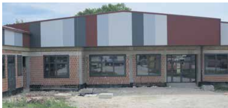
Završena prva faza izgradnje PŠ Cirkvena

106 računala za potrebe projekta e-Dnevnik , kao i za potrebe stručnih službi škola. Županija je osigurala ukupno 284 000 kuna s PDV-om. U tijeku je i nabava namještaja i sportske opreme za novoizgrađenu školu PŠ Cirkvena, a procijenjena vrijednost nabave iznosi 221 000 kuna s PDV-om.