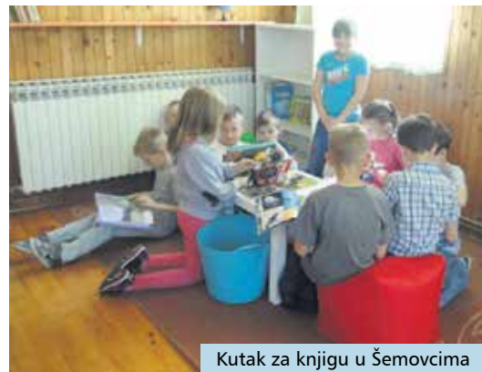
Kutak za knjigu u Šemovcima

Knjižnica i čitaonica „Fran Galović“ prva je knjižnica s TED-ovom licencom u Europskoj uniji, a od 2013. godine, u pet do sada održanih TEDxKoprivnicaLibrary događanja izlagala su 23 ugledna govornika - 400 poklon-paketa s prvom slikovnicom i pozivom na besplatno učlanjenje u knjižnicu podijeljeno je novorođenoj djeci i njihovim majkama u rodilištu koprivničke