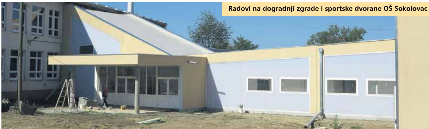
Radovi na dogradnji zgrade i sportske dvorane OŠ Sokolovac