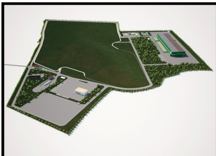
Slika 4.: 3D prikaz planiranog RCGO-a „Piškornica“

Cjelovit sustav gospodarenja otpadom Koprivničko-križevačke županije podrazumijeva izgradnju Regionalnog centra za gospodarenje otpadom „Piškornica“ kao najvažnijeg infrastrukturnog objekta gospodarenja otpadom.