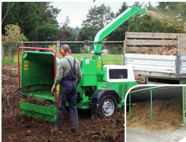
Slika 1. Mobilni sjekač drvene mase

Izvor: Komunalno poduzeće Križevci d.o.o., 2014. god.