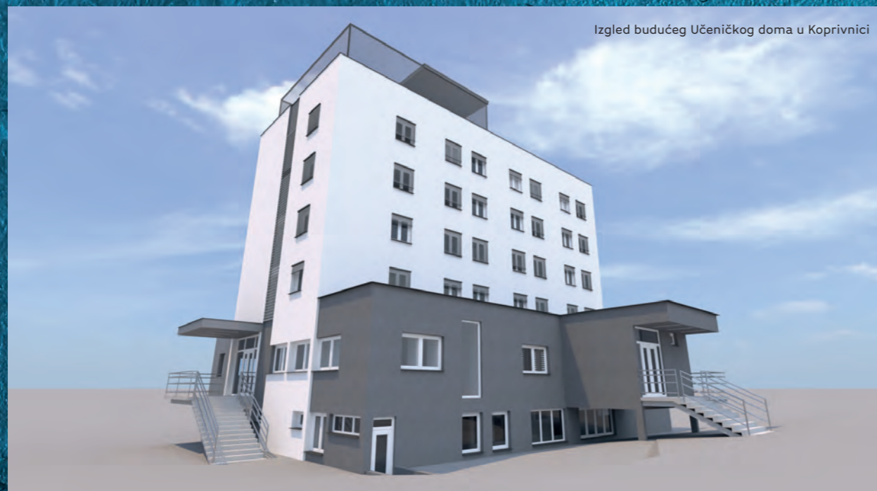
Izgled budućeg Učeničkog doma u Koprivnici