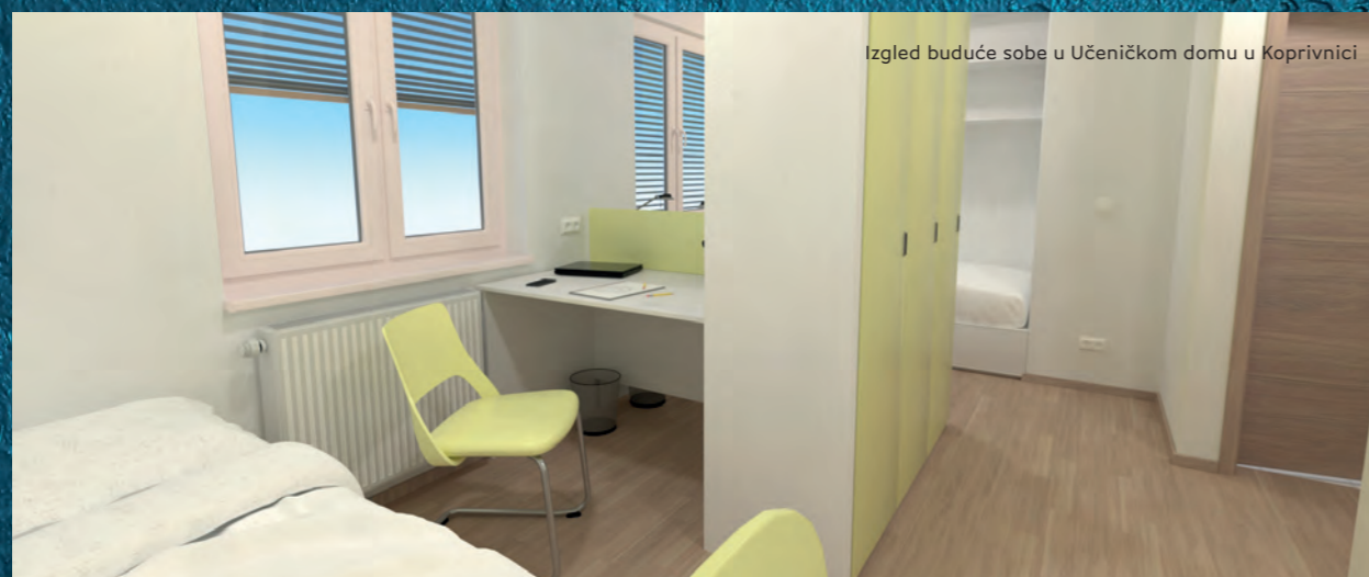
Izgled buduće sobe u Učeničkom domu u Koprivnici

slobodne aktivnosti i spremište. Na 1., 2., 3. i 4. katu bit će smještene trokrevetne sobe za učenike te uz svaku sobu kupaonica sa sanitarnim čvorom, stubišni prostor s liftom i hodnik. Na polovici ravnog krova bit će ograđen prostor za aktivnosti na otvorenom.