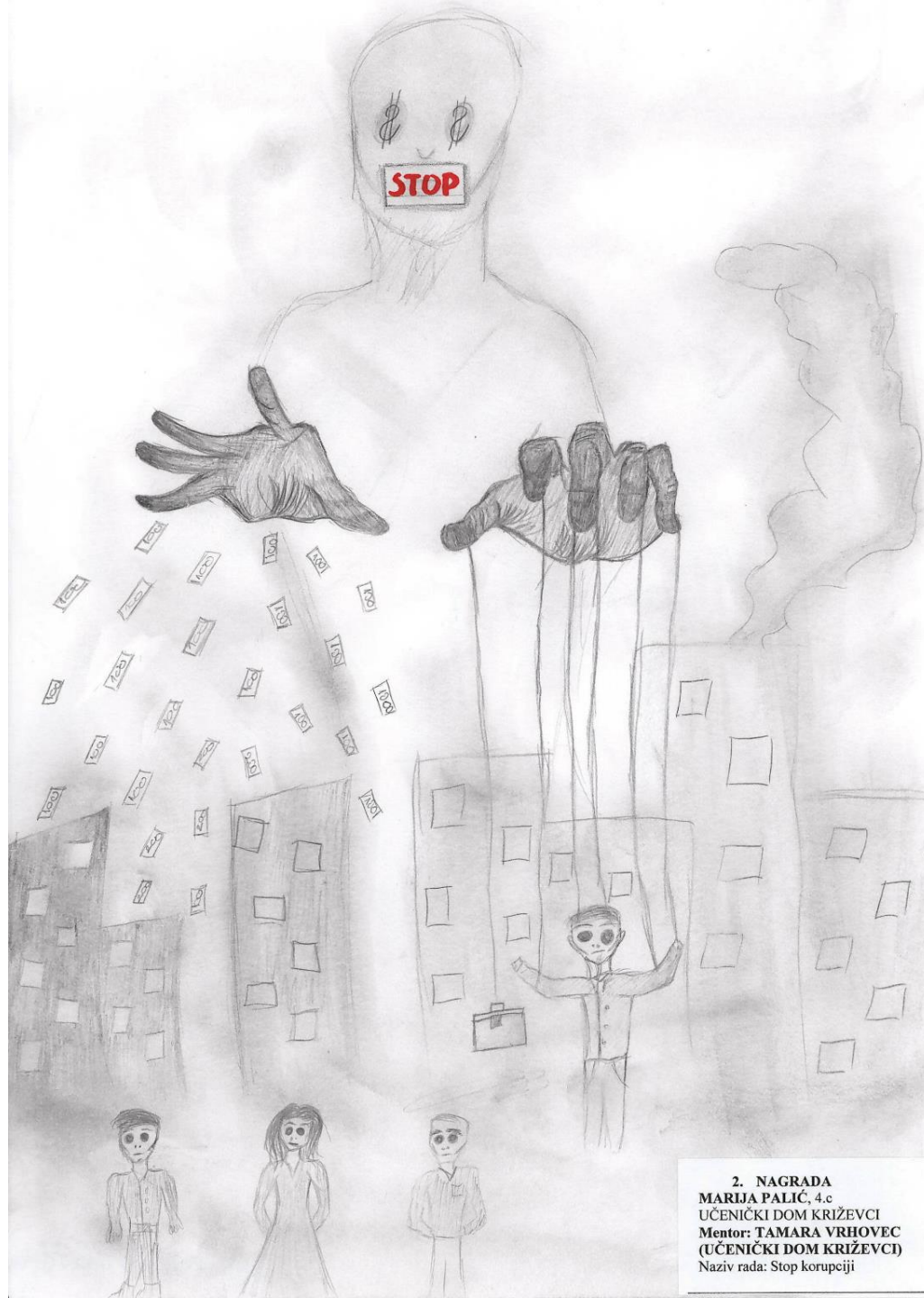
2. NAGRADA MARIJA PALIČ, 4.c UČENIČKI DOM KRIŽEVCI Mentor: TAMARA VRHOVEC (UČENIČKI DOM KRIŽEVCI) Naziv rada: Stop korupciji