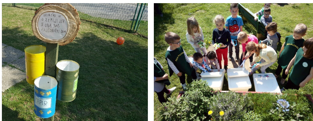
Slika 3.: Spremnici za otpad izrađeni u sklopu projekta u Dječjem vrtiću „Maslačak“ Đurđevac