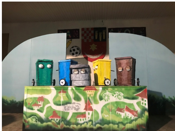
Slika 1.: Scena predstave – spremnici za opad