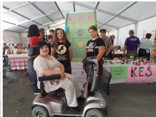
Kreativno edukativna školica—Info točka u Koprivničkom Ivanecu