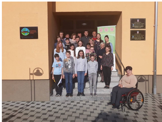
Sudionici aktualnog sata