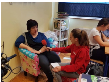
Učenica intervjuira članicu Udruge