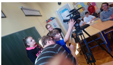
Aktivnost Od medija do medija

U sklopu projekta Želim znati kako imati provedena je aktivnost Od medija do medija u kojoj je sudjelovalo 15 učenika Osnovne škole Koprivnički Ivanec, te članovi Udruge osoba s invaliditetom "Bolje sutra" grada Koprivnice. Kroz četiri školska sata polaznici su učili o osnova ma medija s naglaskom na televizijski medij. Što su mediji, koje vrste medija poznajemo, razlike između tiskanih i elektroničkih medija te razlika između televizije i ostalih elektroničkih medija neka su od pitanja na koja su polaznici dobili odgovore. Upoznali su se s primjerom televizijske vijesti i televizijske reportaže te procesom nastajanja jedne televizijske reportaže. Nakon što su naučili kako nastaje reportaža predložili su pet tema o kojima bi voljeli snimiti svoju tv reportažu te glasanjem odabrali temu Naši učitelji nekada i danas . Kada su naučili sastav ekipe tv reportaže podi-