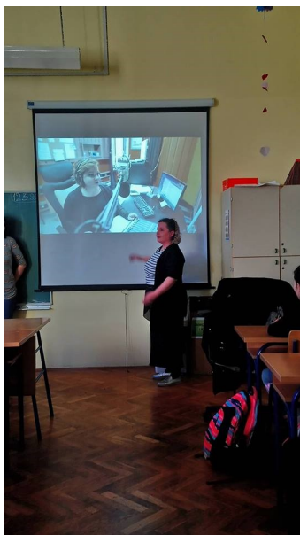
Edukativna radionica: Početnica medijske pismenosti

"Korisnici su saznali koje vrste medija postoje te za što služe mediji."