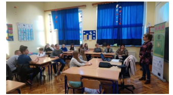
Aktivnost Od medija do medija

Arten von Medien kennen wir, die Unterschiede zwischen Druckmedien und den elektronischen Medien, das waren einige von Fragen auf denen die Teilnehmer die Antworten bekamen. Sie erfuhren die Beispiele einer TV Anzeige und einer TV Reportage, mit dem Prozeß, wie eine Reportage entsteht. Nachdem sie das gelernt und fünf Themen vorgeschlagen haben von denen sie gern eine Reportage aufnehmen möchten, und durch die Stimmabgabe haben sie ein Thema erwählt Unsere Lehrer einst und heute. Als sie die Zusammensetzung der Arbeitsgruppe gelernt haben, werden ihnen die Rollen und die Aufgaben zur Vorbereitung ihr Thema geteilt. Nach zehn Tagen kamen sie bereit auf die Aufnahmen der Reportage. Jeder Teilnehmer mit der Rolle des Journalisten hat die Fragen für seinen Gesprächspartner vorbereitet. Sie haben vier Professoren interviewt um damit zu erfahren warum sie ihre Profession gewählt haben, welche sind Unterschiede in dem Ausbildungssystem einst und heute und ob sie