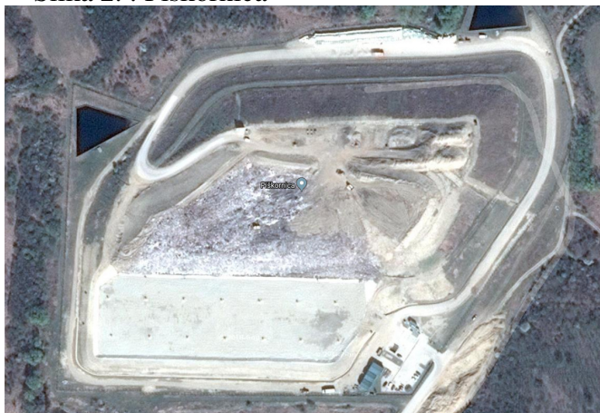
Slika 2. : Piškornica

Procjedne vode iz odlagališta sakupljaju se u vodonepropusnim sabirnim bazenima (lagunama) iz kojih se vrši recirkulacija u tijelo odlagališta.