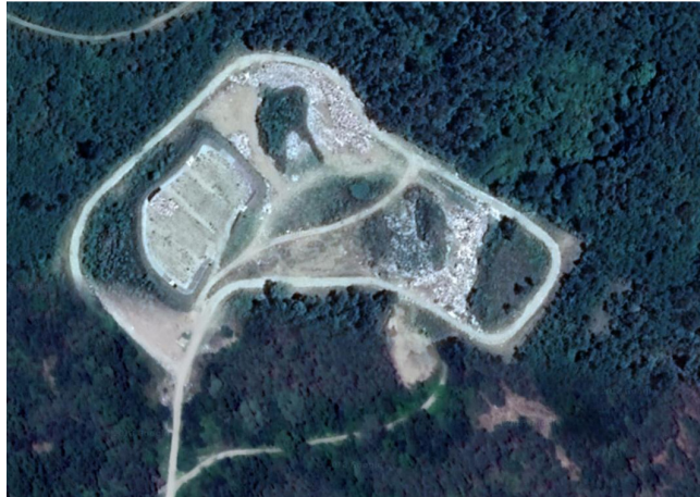
Slika 3. Peski - Đurđevac