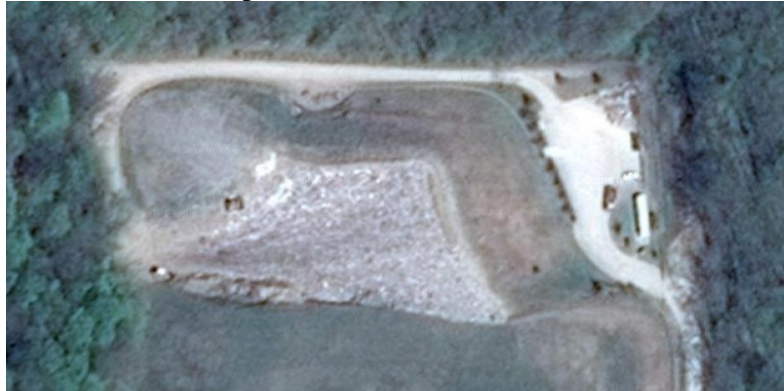
Slika 1. : Ortofoto prikaz „Ivančino brdo“, Križevci