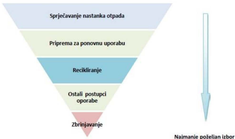
Slika 3. Red prvenstva gospodarenja otpadom u RH i EU

Prioritet cjelovitog sustava gospodarenja otpadom je sprječavanje nastanka otpada. Sukladno Zakonu , sprječavanje nastanka otpada su mjere poduzete prije nego li je tvar, materijal ili proizvod postao otpad, a kojima se smanjuju količine otpada uključujući ponovnu uporabu proizvoda ili produženje životnog vijeka proizvoda, štetan učinak otpada na okoliš ili zdravlje ljudi ili sadržaj štetnih tvari u materijalima i proizvodima. Kako bi zaustavili trend rasta proizvedenog komunalnog otpada, povećali stupanj odvojenog prikupljanja i recikliranja te prilikom toga smanjili udio odloženog biorazgradivog otpada potrebno je uspostaviti sustav gospodarenja komunalnim otpadom koji potiče sprječavanje nastanka otpada na mjestu nastanka i koji sadrži infrastrukturu koja omogućuje ispunjavanje ciljeva i gospodarenje otpadom sukladno redu prvenstva gospodarenja otpadom.