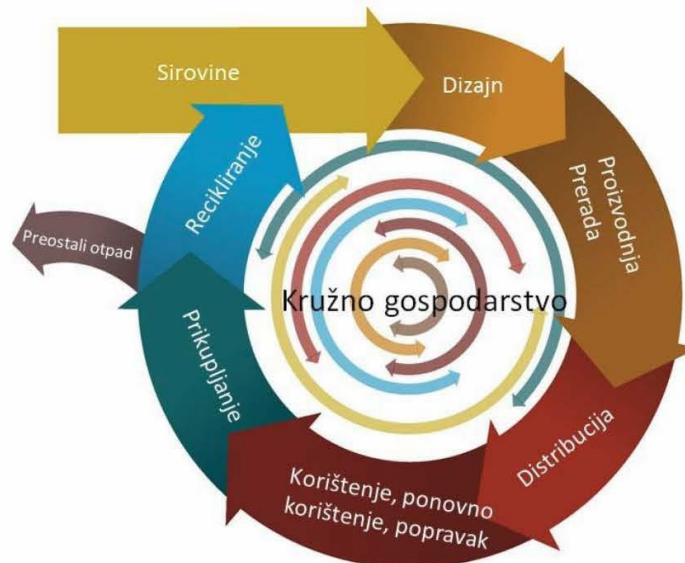
Slika 4. Model kružnog gospodarstva

Prvi korak u cjelokupnom sustavu je osigurati funkcioniranje sustava sprječavanja nastanka otpada koji se odlaže. Sukladno Planu gospodarenja otpadom Republike Hrvatske predlaže se održiv rast, tj. prelazak s postojećeg linearnog na kružno gospodarstvo, ekonomski model koji osigurava održivo gospodarenje resursima i produživanje životnog vijeka materijala i proizvoda. Cilj ovog modela je svesti nastajanje otpada na najmanju moguću mjeru i to ne samo otpada koji nastaje u proizvodnim procesima, već sustavno, tijekom čitavog životnog ciklusa proizvoda i njegovih komponenti.