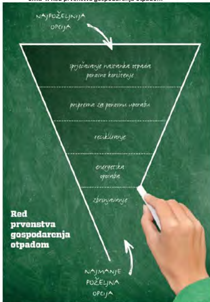
Slika 4. Red prvenstva gospodarenja otpadom