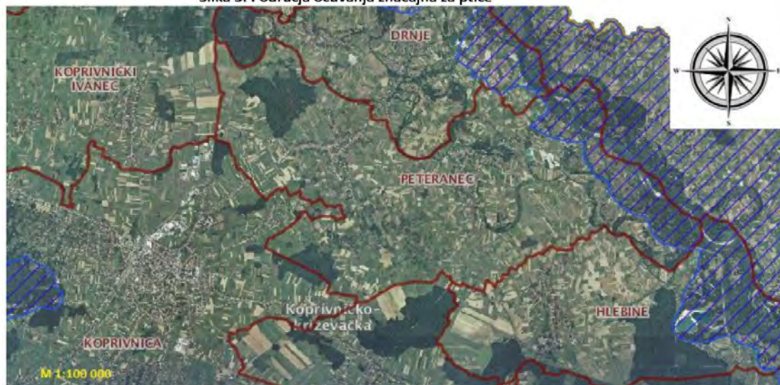
Slika 3. Područja očuvanja značajna za ptice