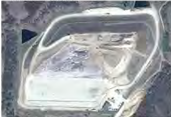
Slika 2. : Piškornica

Ulazno-izlazna zona na odlagalištu obuhvaća objekte predviđene za smještaj opreme i boravak radnika (ulazna vrata, objekt za zaposlene, plato za pranje vozila, sabirni bazen za sanitarne otpadne vode, parkiralište). Oborinske vode sa zatvorenog djela odlagališta prikupljaju se u obodnom kanalu te se preko taložnika ispuštaju u vodotok Gliboki. Trenutno su u tijeku radovi čišćenja obodnih kanala za oborinske vode i kanala za ispust oborinskih voda, te ugradnja zapornice kako bi se u slučaju incidentnih situacija mogao zatvoriti ispust oborinskih voda s prostora odlagališta prema vodotoku Gliboki. Proejedne vode iz odlagališta sakupljaju se u vodonepropusnim sabirnim bazenima (lagunama) iz kojih se vrši recirkulacija u tijelo odlagališta.