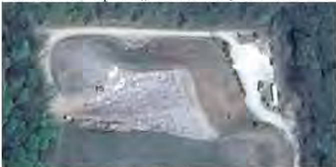
Slika 1. : Ortofoto prikaz „Ivančino brdo“, Križevci