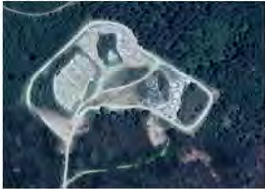
Slika 3. Peski - Đurđevac