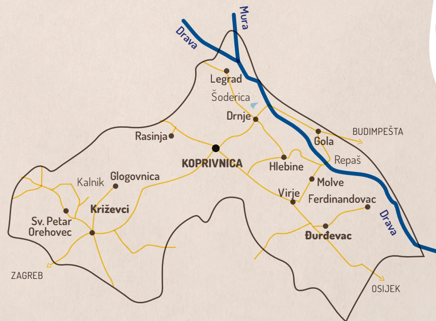
Karta Hrvatske i županije ilustrativnog su karaktera.