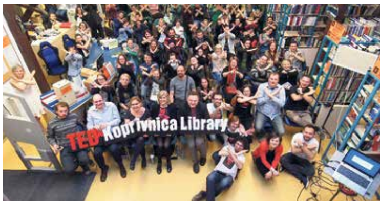
Sedma konferencija TEDxKoprivnicaLibrary još jednom je okupila zanimljive govornike i veliki broj posjetitelja

- više o svim održanim programima i nadolazećim događanjima na www.knjiznica-koprivnica.hr .