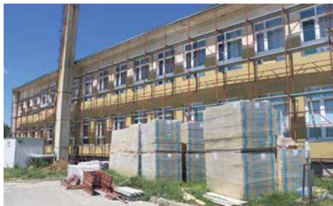
Građevinsko-obrtnički radovi na postojećoj zgradi Škole u Sokolovcu

Za V. fazu izgradnje Osnovne škole Legrad Ministarstvo regionalnoga razvoja i fondova Europske unije odobrilo je 470 tisuća kuna sufinanciranja.