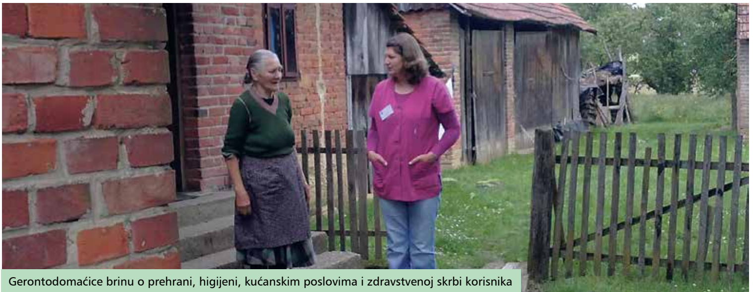
Gerontodomaćice brinu o prehrani, higijeni, kućanskim poslovima i zdravstvenoj skrbi korisnika

Klub za starije osobe Mariška , a partneri projektu su Koprivničko-križevačka županija, PORA Razvojna agencija Podravine i Prigorja te Gradsko društvo Crvenog križa Križevci.