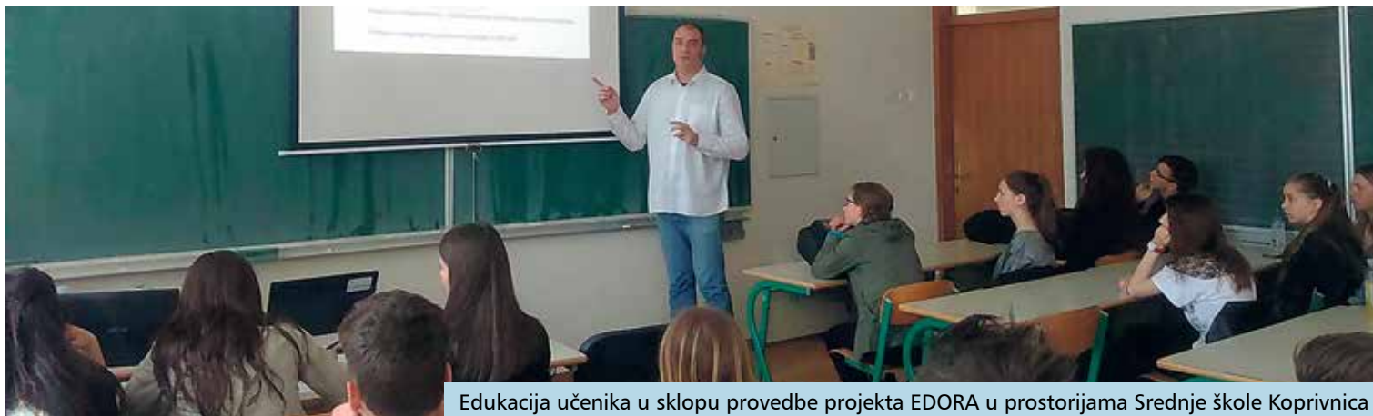
Edukacija učenika u sklopu provedbe projekta EDORA u prostorijama Srednje škole Koprivnica

Nositelj ovog projekta je Koprivničko-križevačka županija, a njegova vrijednost je 102 tisuće kuna, od čega 80 posto sufinancira Fond za zaštitu okoliša i energetske učinkovitost. Osim toga, Koprivničko-križevačka županija zajedno s Varaždinskom i Međimurskom županijom sudjeluje i u izradi Masterplana Sjever ukupne vrijednosti 5,2 milijuna kuna.