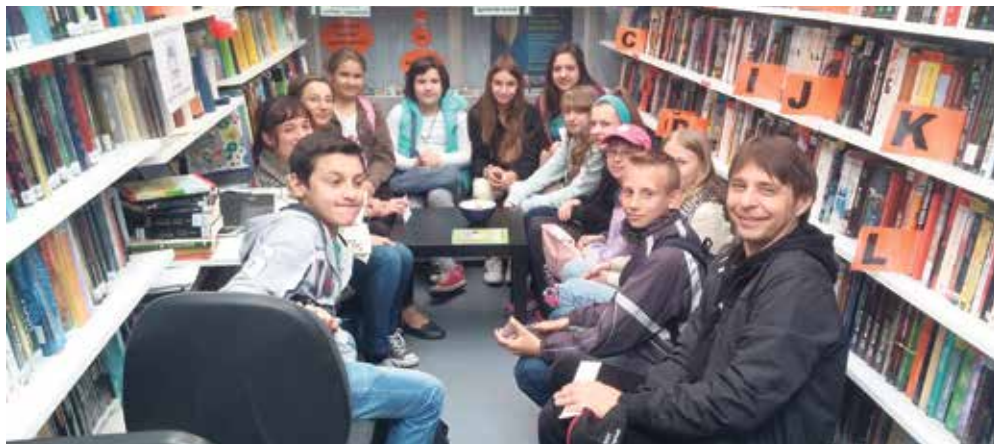
Posjet učenika OŠ Martijanec koji su po prvi put imali priliku vidjeti bibliobus