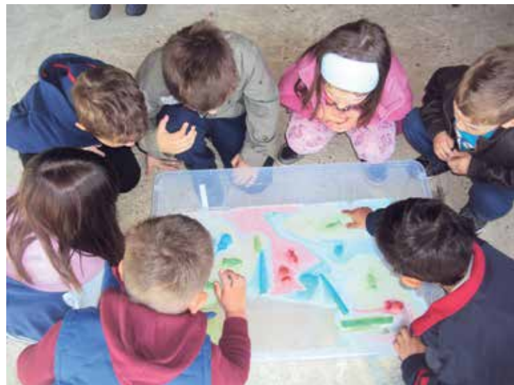
Djeca istražuju u Knjižnici

- pričaonica u Dječjem vrtiću Zrno Virje uz Međunarodni dan dječje knjige na temu slikovnica Beatrix Potter te likovna radionica na kojoj su djeca sama crtala ilustracije za njezine priče te je tako nastala nova slikovnica Djevojčica koja je voljela crtati koju je kao svoj dar djeci i Knjižnici ručno uvezao Zoran Vidaković, učitelj iz Đurđevca.