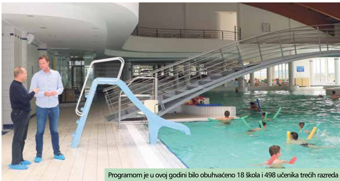
Programom je u ovoj godini bilo obuhvaćeno 18 škola i 498 učenika trećih razreda

Koprivničko-križevačka županija nastavlja sufinancirati program obuke neplivača učenika trećih razreda osnovnih škola kojima je osnivač, a koji se odvija u bazenima Cerine u Koprivnici. Programom je u ovoj godini bilo obuhvaćeno 18 škola i 498 učenika trećih razreda, a ukupna cijena obuke neplivača iznosila je 285 kuna po učeniku, od čega je Županija sufinancirala 163 kune, kao i prijevoz učenika i njihovih pratitelja do bazena. Ulaznice za bazen škole su podmirivale same, a Ugovor o provedbi ovog projekta u vrijednosti od 81 174 kune potpisan je s Udrugom kineziologa Grada Koprivnice.