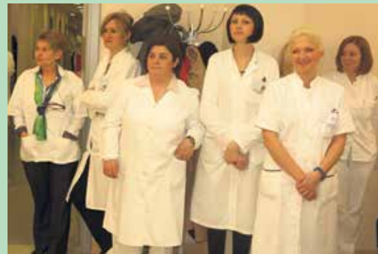
Djelatnice Zavoda za javno zdravstvo

U sklopu obilježavanja održan je i Dan otvorenih vrata pa je tako organiziran posjet vrtićanaca, u Domu za starije održane su aktivnosti za rano otkrivanje raka, dok je u Matici umirovljenika održano predavanje o zdravom i aktivnom starenju.