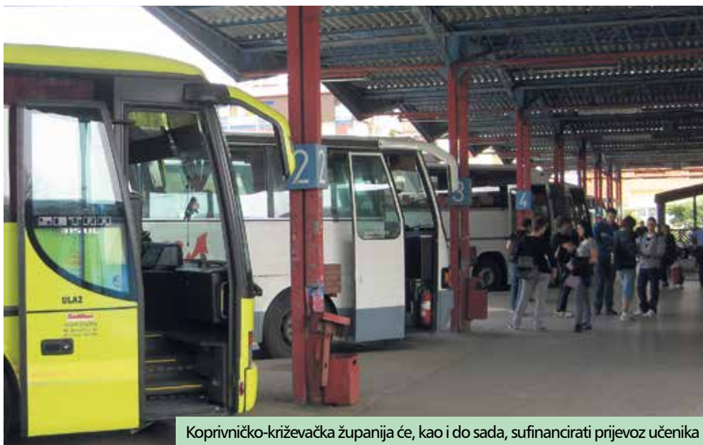
Koprivničko-križevačka županija će, kao i do sada, sufinancirati prijevoz učenika

Potpisujući ugovore, župan je istaknuo kako se nada da će i nova Vlada podržati projekt sufinanciranja prijevoza srednjoškolaca, a Koprivničko-križevačka županija će zasigurno iznaći sredstva da, kao i do sada, sufinancira ovaj prijevoz.