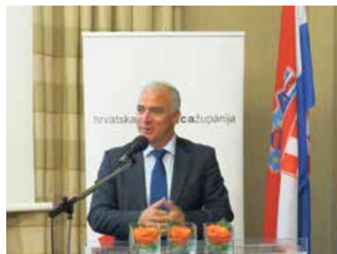
Novi predsjednik: župan Šibensko-kninske županije Goran Pauk

Na europskoj razini predstavnici Zajednice sudjelovali su u radu Kongresa lokalnih i regionalnih vlasti Vijeća Europe, Vijeća europskih općina i regija CEMR, provođenju velikog europskog projekta LADDER i Odboru regija. Predsjednik hrvatske delegacije u Odboru regija Europske unije i dubrovačko-neretvanski župan Nikola Dobroslavić imenovan je izjaviteljem za izradu dokumenata Mišljenje Odbora regija o jačanju prekogranične suradnje i potrebi za regulatornim okvirom .