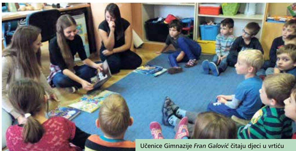
Učenice Gimnazije Fran Galović čitaju djeci u vrtiću

Mjesec hrvatske knjige, koji se svake godine obilježava od 15. listopada do 15. studenog, i ove jeseni obilovao je brojnim programima u narodnim i školskim knjižnicama širom Koprivničko-križevačke županije. Dio aktivnosti u Mjesecu knjige redovito se odvija i u suradnji različitih knjižnica, obrazovnih i drugih ustanova i udruga. Jedna od najpoznatijih takvih zajedničkih manifestacija bila je akcija Koprivnica čita , koja je provedena 22. i 23. listopada 2015. s ciljem poticanja čitanja i pismenosti kao neophodnih vještina te neizostavnog kulturnog sadržaja u životu