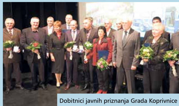
Dobitnici javnih priznanja Grada Koprivnice