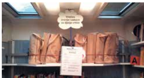
Vrećice znanja i zabave u koprivničkom bibliobusu

anđelima... U samoj Knjižnici čitali su se i autorski radovi samih sudionika, kao i poezija napisana na brajci! Uz samo čitanje i razgovor o pročitanim, osobito u vrtićima odvijale su se i druge zabavne aktivnosti - zajedno s djecom, uz puno smijeha i veselja, učenici i studenti su se igrali, glumili, svirali, pjevali, crtali i slikali, a susreti su u pravilu završavali