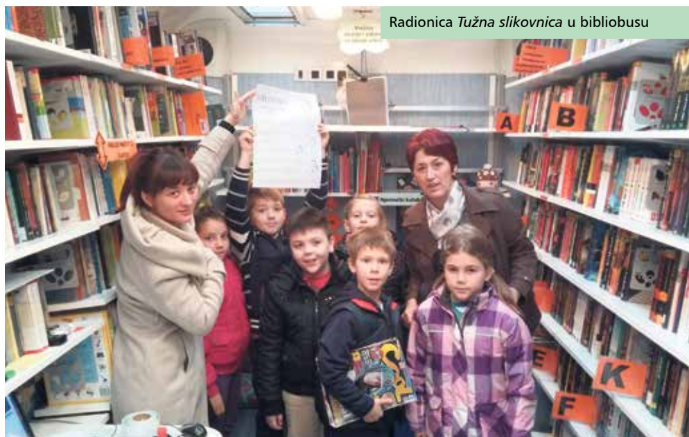
Radionica Tužna slikovnica u bibliobusu

Program bibliopedagogije Tužna slikovnica provodi se u obliku radionice čiji je cilj igrom i praktičnim primjerima naučiti najmlađe korisnike kako čuvati posuđene knjige i slikovnice te kako se s knjižničnom građom ne smije postupati i zašto. Tijekom radionice djeca na praktičnim primjerima usvajaju znanja o tome kako ne oštećivati knjige, kako popraviti one oštećene te kako se knjige omataju zaštitnom folijom. Škole i razredi zainteresirani za održavanje ove radionice mogu se prilikom dolaska bibliobusa na stajalište svakog radnog dana javiti njihovoj posadi na mobilni telefon 098 970 02 12 te dogovoriti termin.