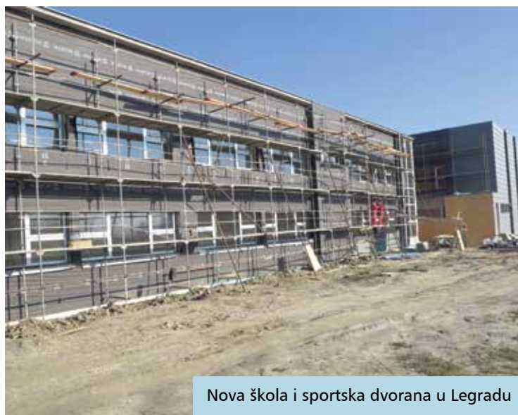
Nova škola i sportska dvorana u Legradu

milijuna kuna te će se nastojati provesti kroz model javno-privatnog partnerstva.