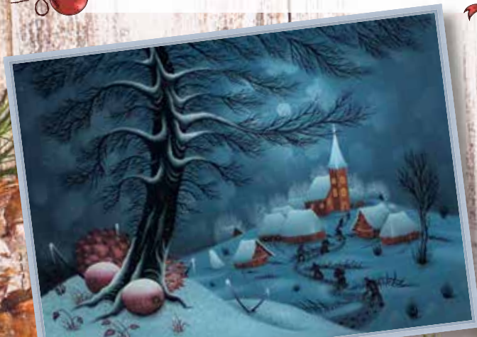
Josip Novoselec, Polnočka, 2009., ulje/staklo, 460 x 620 mm, vlasništvo Muzeja grada Koprivnice