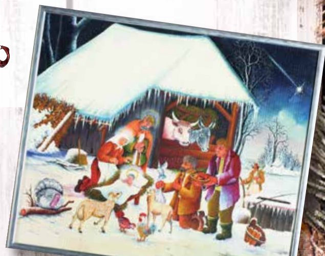
Zlatko Štrfliček, Darivanje Sina Božjega, 2006., ulje/platno, 500 x 600 mm, vlasništvo Muzeja grada Koprivnice