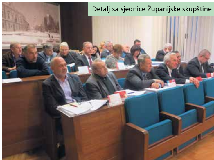
Detalj sa sjednice Županijske skupštine

Članovi Skupštine prihvatili su prijedlog Pravilnika o financiranju programa i projekta udruga koje su od interesa za Županiju te podržali antikorupcijske programe za trgovačka društva koja su u vlasništvu/suvlasništvu