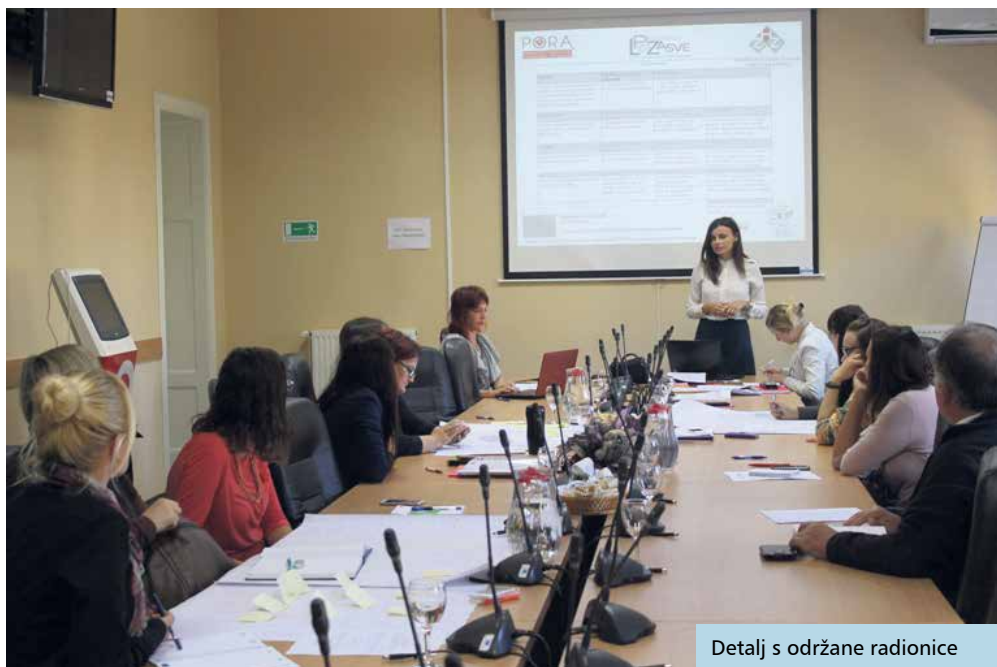
Detalj s održane radionice

Osim radionica za izradu Strategije razvoja ljudskih potencijala Koprivničko-križevačke županije za razdoblje 2014. - 2020., u okviru projekta će se održati i šest projektnih klinika na kojima bi se, paralelno s izradom Strategije, razvijali i pripremali projekti koji će se prijavljivati na natječaje iz Europskog socijalnog fonda, a koji su usmjereni na ostvarivanje ciljeva iz Strategije. Tijekom rujna provedena je i trodnevna radionica za članove Lokalnog partnerstva za zapošljavanje na temu Upravljanje projektnim ciklusom i strateško planiranje.