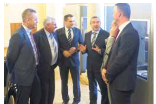
Hrvatski župani u Klagenfurtu

Koprivničko-križevačka županija zadovoljna je suradnjom između članica SAA budući da su regije surađivale u pripremi zajedničkih projekata Europske unije, a udruge i organizacije imale su mogućnost za financiranje projektnih aktivnosti sredstvima SAA za zajedničke projekte. U koordinaciji Županije tako je za zajedničke projekte u Podravini i Prigorju tijekom 2014. i 2015. SAA odobrio 21 450 eura. Isto tako su realizirana dva projekta EU-a u programu Erasmus+, a u suradnji s pojedinim partnerima s područja SAA u pripremi su i dva veća transnacionalna projekta.