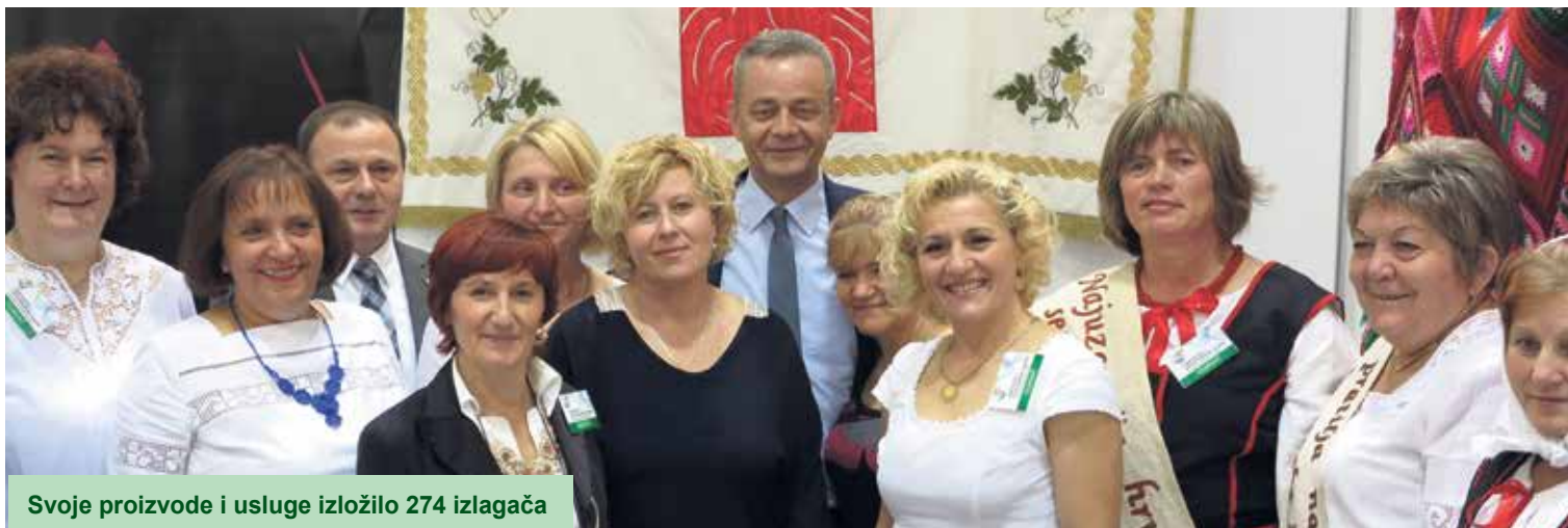
Svoje proizvode i usluge izložilo 274 izlagača