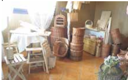
Proizvodi obrta Bačvarije Ledinski