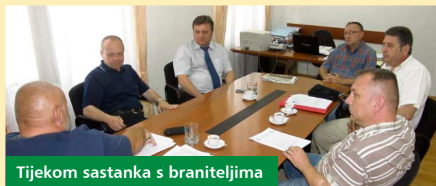
Tijekom sastanka s braniteljima

Županija je iskazala interes da se uključi u ovaj projekt, a uz brojne sudionike Domovinskog rata izlaganjima bi se pridružili i general Đuro Dečak te zapovjednik specijalne policije u Domovinskom ratu general Mladen Markač.