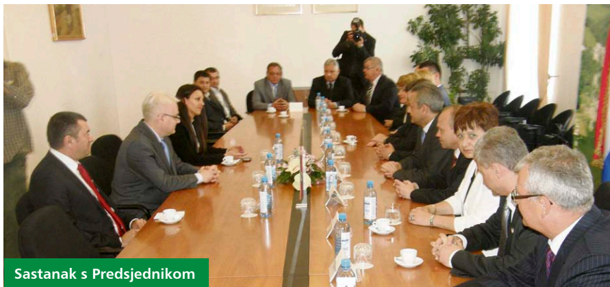
Sastanak s Predsjednikom