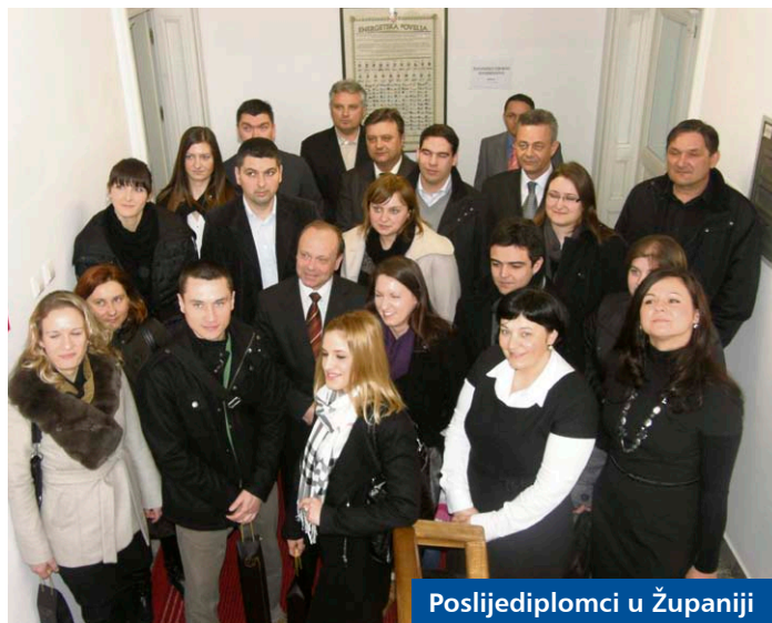
Poslijediplomci u Županiji

Studenti koji završe studij u roku dužni su vratiti pola primljenog iznosa kredita, a Županija poslovnoj banci vraća drugu polovinu te namiruje kamatu