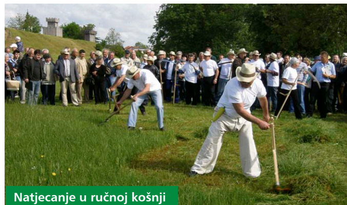
Natjecanje u ručnoj košnji

ska škola iz Križevaca održala je prikaz cijepljenja voćaka, a posjetitelji su imali prilike vidjeti i prezentaciju konjogojske udruge „Bilogorski rendžeri“ te prisustvovati konjičkom turniru u preponskom jahanju „Croatia cup“. Posjetitelji su tijekom Sajma mogli uživati i u programu Udruge cimbalista Hrvatske te nastupima kulturno-umjetničkih društava s područja Podravine i Prigorja.