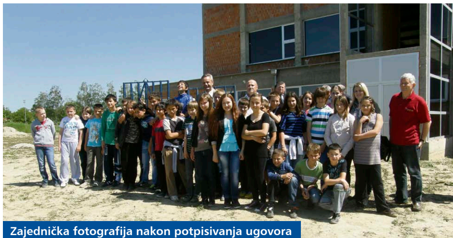
Zajednička fotografija nakon potpisivanja ugovora

Druga faza radova podrazumijeva izgradnju školske zgrade „do pod krov“ neto površine 1630 četvornih metara u vrijednosti 3,7 milijuna kuna