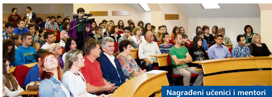
Nagrađeni učenici i mentori

Kroz razgovor se došlo i do teme nedostatka kontinuiteta u nacionalnim obrazovnim strategijama, a učenici su iznijeli različita mišljenja o tome treba li gimnazijski program nuditi više specijaliziranih modula između kojih bi učenici mogli birati. Također su zaključili kako je hrvatski sustav obrazovanja cijenjen u nekim stranim državama upravo zahvaljujući širini i obujmu znanja koje učenici usvajaju, dok u nekim zemljama učenici uče samo o strogo ograničenim područjima za koja su se opredijelili.