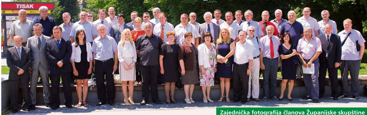
Zajednička fotografija članova Županijske skupštine

Konstituirajuća sjednica novog saziva Županijske skupštine Koprivničko-križevačke županije održana je 18. lipnja u prostorima gradske vijećnice u Koprivnici. Sjednicu je sazvala predstojnica Ureda državne uprave u Koprivničko-križevačkoj županiji Elizabeta Repić Perković koja je uvodno i vodila sjednicu.