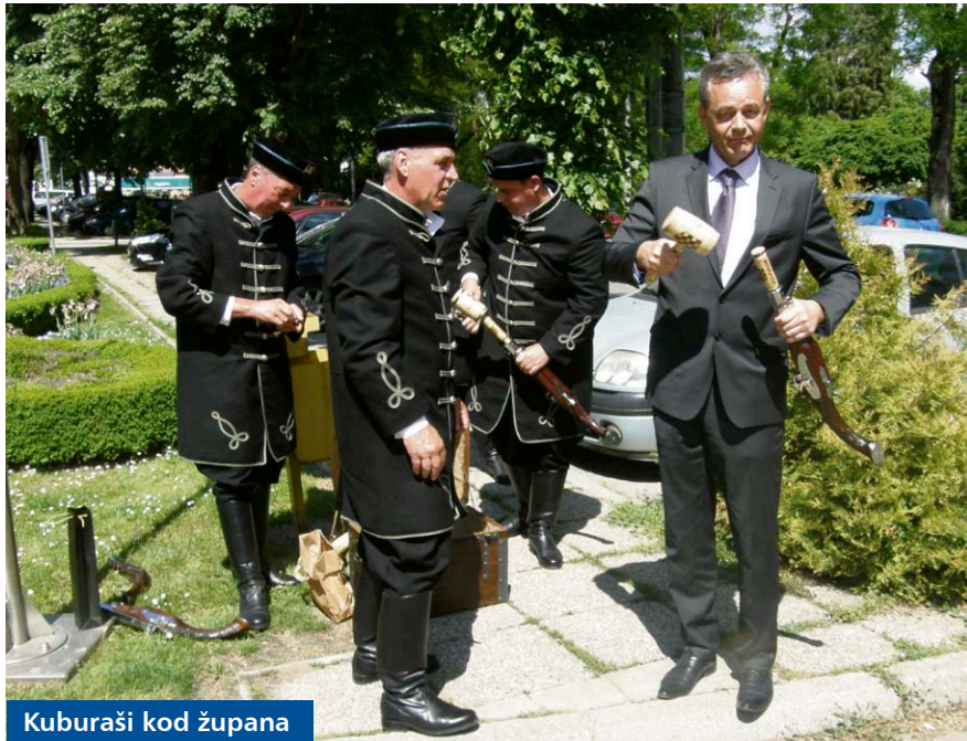
Kuburaši kod župana

Župan Darko Koren primio je 14. svibnja predstavnike Kuburaškog društva Koprivnica i Udruge Zagoraca Podravine. Riječ je o udrugama koje doprinose društvenom životu ovoga kraja te su svojim atraktivnim nastupima potaknule i ostale na dodatni angažman na promociji tradicije i čuvanju kulturne baštine.