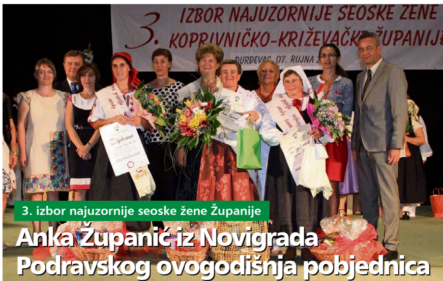
3. izbor najuzornije seoske žene Županije