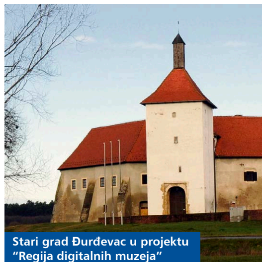
Stari grad Đurđevac u projektu „Regija digitalnih muzeja“

Projekt „Regija digitalnih muzeja“ provodi se za Muzej grada Koprivnice, Stari grad Kalnik i Stari grad Đurđevac, a u projektu za razvoj tehnološke infrastrukture sudjeluju dva grada iz naše Županije - Koprivnica i Križevci