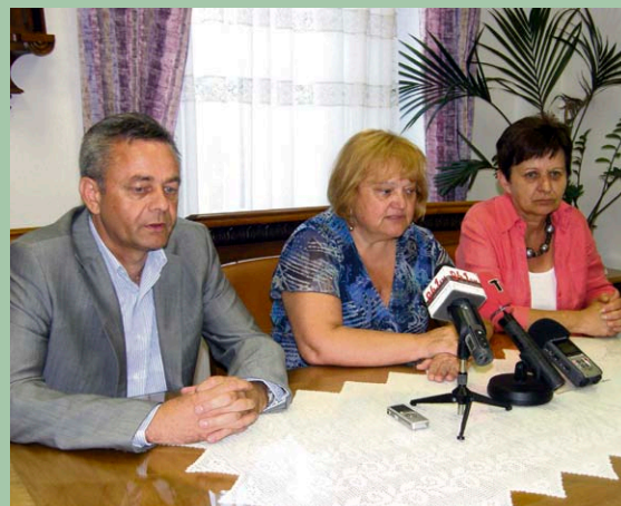
Župan Darko Koren, ministrica Anka Mrak Taritaš i gradonačelnica Koprivnice Vesna Željeznjak

Županija je za legalizaciju osigurala devet izvršitelja stalno zaposlenih u Upravnom odjelu za prostorno uređenje, gradnju i zaštitu okoliša te šest volontera-vježbenika.