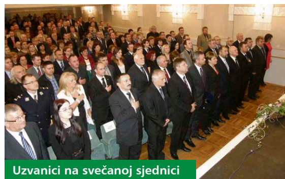
Uzvanici na svečanoj sjednici