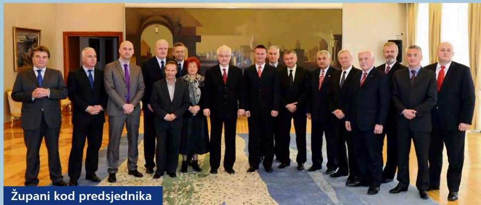
Župani kod predsjednika

Župan Koren se stoga slaže sa svojim kolegama iz Hrvatske zajednice županija da je Hrvatskoj potrebna daljnja fiskalna decentralizacija jer bi lokalna i regionalna zajednica samostalno puno učinkovitije upravljala onim sustavima za koje je zadužena, a to je na pojedinim primjerima praksa već i pokazala.