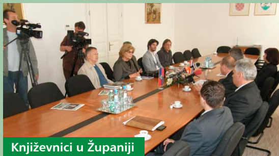
Književnici u Županiji