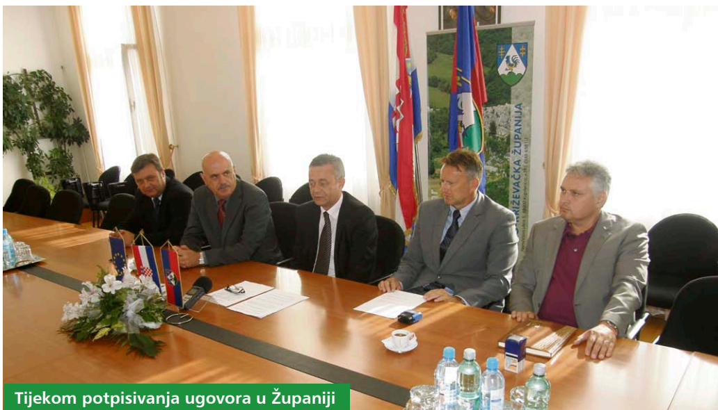
Tijekom potpisivanja ugovora u Županiji

Ova cijena vrijedit će neovisno o mjestu stanovanja učenika budući da se učenicima iz svih dijelova Županije želi omogućiti jednaka dostupnost srednjoškolskom školovanju