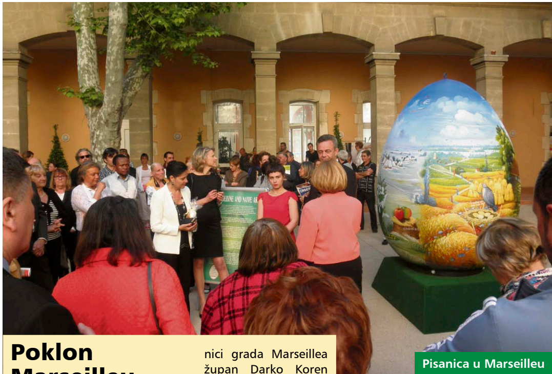
Pisanica u Marseilleu