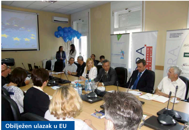
Obilježen ulazak u EU

PORA je u proteklom periodu provela niz projekata EU-a ukupne vrijednosti četiri milijuna eura