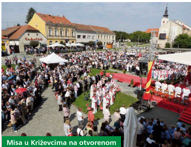
Misa u Križevcima na otvorenom