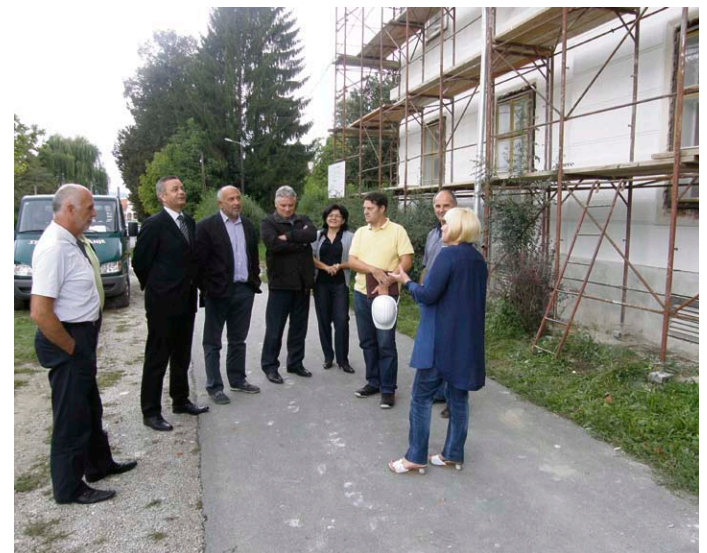
Obilazak radova na zgradi Učeničkog doma u Križevcima

Prihvaćen je tako projekt poticanja energetske učinkovitosti u kućanstvima koji će se tijekom 2013. i 2014. godine sufinancirati iznosom od 400 tisuća kuna. Za poboljšanje energetske učinkovitosti sufinancirat će se i radovi na rekonstrukciji zgrade srednjih škola u Koprivnici s 2,7 milijuna kuna te na Učeničkom domu u Križevcima s 530 tisuća kuna.