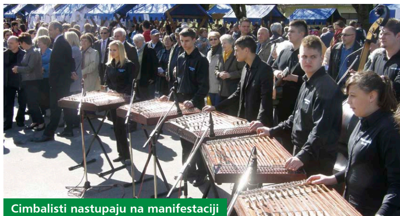
Cimbalisti nastupaju na manifestaciji

U uvodnom dijelu kulturno-umjetničkog programa nastupili su članovi Kuburaškog društva Koprivnica te Udruga cimbalista Hrvatske, a program je nastavljen nastupima vrtića iz Đelekovca i Gole. Nakon odličnih nastupa najmlađih predstavila se i Udruga prijatelja kulture „Vlado Dolenc“ te udruge Gotalovečko srce i Potkalnički plemenitaši iz Gornje Rijeke. Prisutnima su se tom prigodom obratili gradonačelnica Koprivnice Vesna Želježnjak i župan Darko Koren koji je manifestaciju i otvorio.