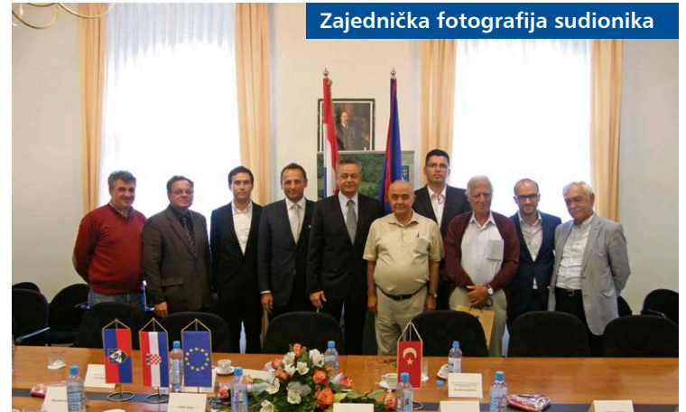
Zajednička fotografija sudionika

Tvrtka već ima sagrađena tri geotermalna postrojenja u Turskoj te je među najvećim proizvođačima energije iz geotermalnih izvora u Europi