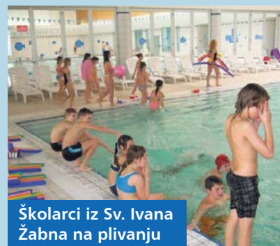
Školari iz Sv. Ivana Žabna na plivanju