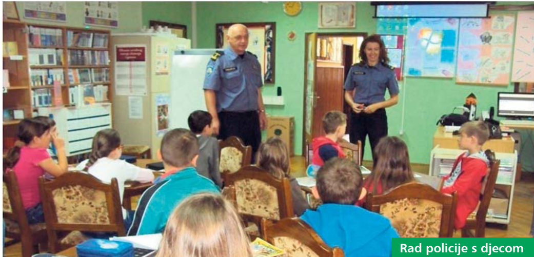
Rad policije s djecom

Županijsko vijeće za prevenciju u lokalnoj zajednici održalo je sjednicu u četvrtak 7. ožujka u prostorima Županije. Nakon uvodne riječi župana Darko Korena, koji je ujedno i predsjednik ovoga Vijeća, načelnik Policijske uprave koprivničko-križevačke Darko Rep dao je kraći osvrt na stanje sigurnosti u protekloj godini. Istaknuo je kako statistički podaci pokazuju da je stanje sigurnosti u odnosu na 2012. godinu poboljšano. To se iščitava iz podataka o smanjenju broja kaznenih djela i remećenja javnog reda i mira u odnosu na 2011. godinu, smanjenju broja teško stradalih u prometnim nesrećama te stope gospodarskog kriminaliteta.