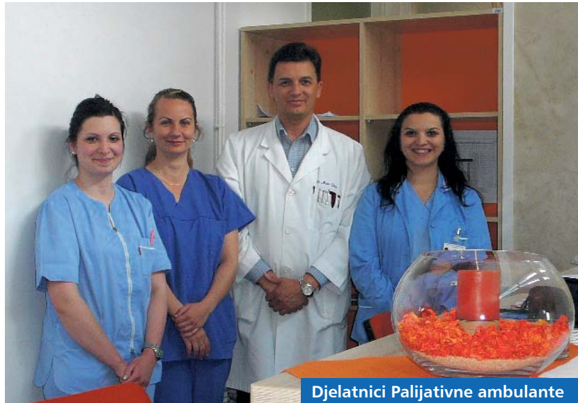
Djelatnici Palijativne ambulante

Koprivnička Opća bolnica prva je u Hrvatskoj otvorila Ambulantu i dnevni boravak za palijativne bolesnike