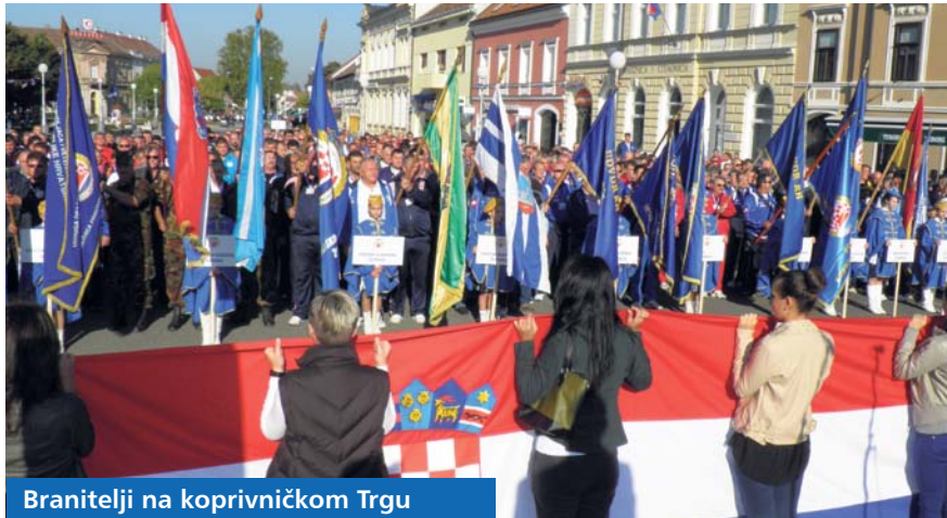
Branitelji na koprivničkom Trgu

U Koprivnici je 5. i 6. listopada održano 17. državno športsko natjecanje dragovoljaca i veterana Domovinskog rata. Ovo Državno natjecanje organizirala je Udruga dragovoljaca i veterana Domovinskog rata RH pod pokroviteljstvom Ministarstva branitelja i Koprivničko-križevačke županije. U dvodnevним susretima branitelji su se natjecali u sportskom ribolovu, streljaštvu, stolnom tenisu, malom nogometu, povlačenju koplja, kuglanju, šahu i elektronskom pikadu. Ukupni pobjednici natjecanja bili su