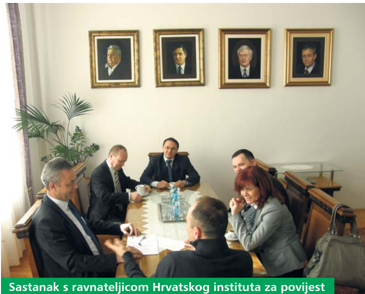
Sastanak s ravnateljicom Hrvatskog instituta za povijest

Ispostava u Koprivnici pokrivala bi područje sjeverozapadne Hrvatske