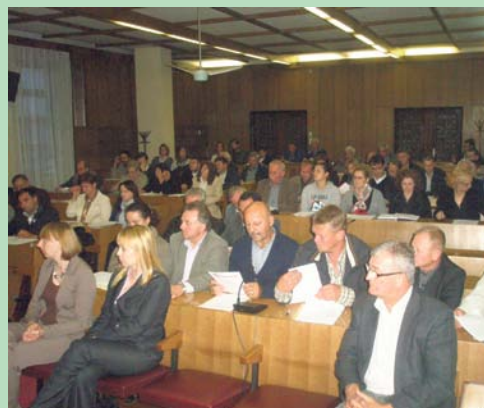
Sastanci članova LAG-a

Na sjednici Skupštine održanoj 26. veljače prihvaćena je Lokalna razvojna strategija LAG-a „PODRAVINA“ za 2013. i 2014. godinu koja predstavlja temeljni strateški dokument razvoja LAG-a i osnovni je preduvjet za prijavu na očekivani natječaj u okviru Mjere 202 IPARD Programa.