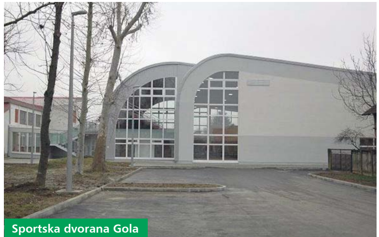
Sportska dvorana Gola