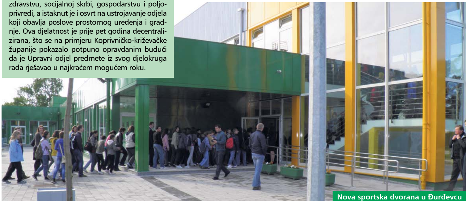
Nova sportska dvorana u Đurđevcu