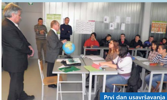
Prvi dan usavršavanja

– To će uvelike povećati vašu vrijednost na tržištu rada i usmjeriti vas u dobrom pravcu – rekao je zamjenik župana Pal.