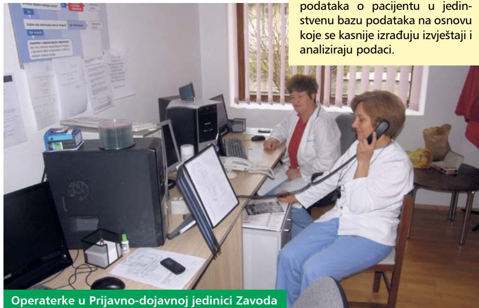
Operaterke u Prijavno-dojavnoj jedinici Zavoda

Uz timove hitne medicine, unutar Zavoda djeluje i Prijavno-dojavna centralna jedinica Koprivnica u kojoj se zaprimaju svi pozivi s područja Županije. Prijavno-dojavna jedinica opremljena je suvremenim informacijsko-komunikacijskim sustavom koji se sastoji od nekoliko segmenata koji dispečeru omogućuje prihvatanje poziva, međusobnu komunikaciju djelatnika službe, uvid u stanje na terenu i odabir najbližeg vozila za intervenciju te lociranje mjesta nesreće i upućivanje vozila na mjesto intervencije. Sustav omogućuje pohranu svih podataka o pacijentu u jedinstvenu bazu podataka na osnovu koje se kasnije izrađuju izvještaji i analiziraju podaci.