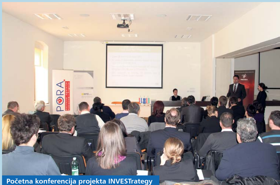
Početna konferencija projekta INVESTStrategy

Kao glavnom korisniku PORA-i je za provedbu odobren projekt EU COMPASS2 koji je usmjeren na edukaciju u pripremi i provedbi projekata EU-a za strukturne fondove EU-a