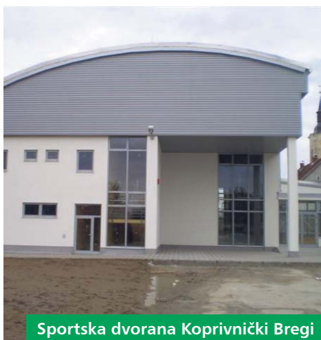
Sportska dvorana Koprivnički Bregi