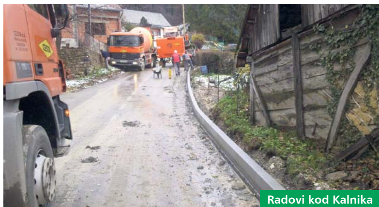
Radovi kod Kalnika

S obzirom na to da su Hrvatske ceste tijekom 2012. godine rasporedile dodatna sredstva za investicijske radove na županijskim i lokalnim cestama, Županijska uprava za ceste Koprivničko-križevačke županije je za obnovu i modernizaciju na području Podravine i Prigorja dobila 13,6 milijuna kuna. Prema planu radova, obnova i modernizacija je ugovorena za 21 dionicu cesta, a radovi su počeli tijekom listopada. Ovim radovima izvedena je obnova 26 kilometara i modernizacija 9 kilometara prometnica na području cijele Županije (nadcestarije Koprivnica, Kri-