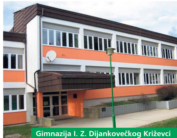
Gimnazija I. Z. Dijankovečkog Križevci

Završena je prva faza izgradnje nove školske zgrade i školske sportske dvorane Osnovne