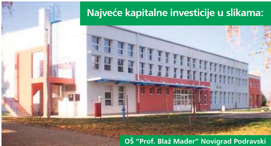
OŠ "Prof. Blaž Mađer" Novigrad Podravski

Najveće kapitalne investicije u slikama: