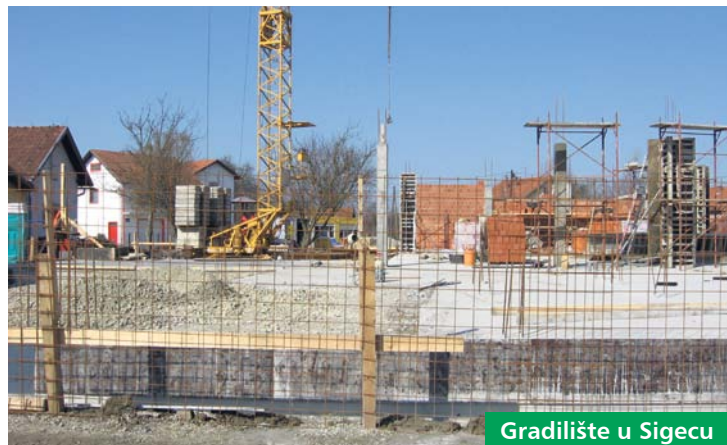
Gradilište u Sigecu

školske zgrade, a izvršit će se toplinska izolacija fasade (2.770 četvornih metara) i ravnog krova (1.660 četvornih metara) te zamjena više od 70 prozora. Nakon što se izvede rekonstrukcija zgrade, značajno će se poboljšati toplinske karakteristike dijela građevine, i to za čak pet energetske razreda (s energetske razreda G na energetske razred B). U navedenoj školskoj zgradi smještene su dvije srednje škole: Srednja škola Koprivnica s 1.096 učenika i Obrtnička škola Koprivnica sa 784 učenika.