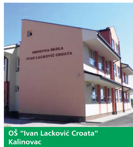
OŠ "Ivan Lacković Croatia" Kalinovac