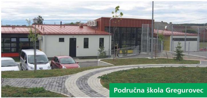
Područna škola Gregurovec