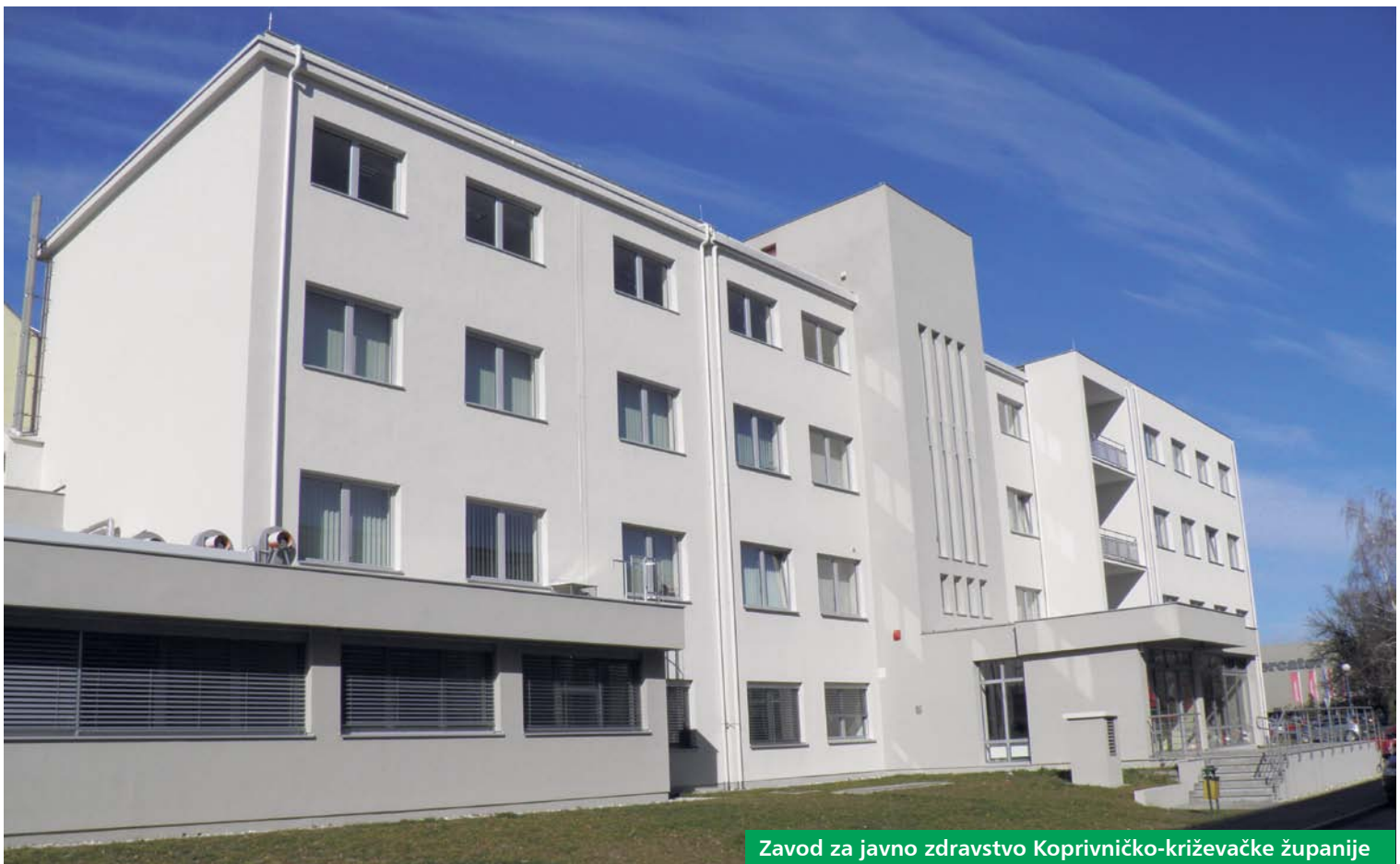
Zavod za javno zdravstvo Koprivničko-križevačke županije

Slušajte emisiju "Županijsko zvono" srijedom od 12.30 na Radiju Dravi