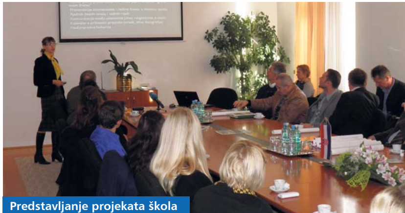
Predstavljanje projekata škola

U prostorijama Županije je 27. studenoga održana prezentacija projekata EU-a koje provode srednje i osnovne škole na području Koprivničko-križevačke županije. Svoje su projekte prezentirali predstavnici Gimnazije „Fran Galović“ Koprivnica, Osnovne škole Koprivnički Bregi, Gimnazije dr. Ivana Kranjčeva Đurđevac, Obrtničke škole Koprivnica i Srednje škole Koprivnica. Svi projekti vezani su uz razmjenu iskustava i znanja između partnera, očuvanje kulturne baštine te uključivanje uče-