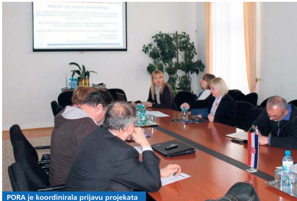
PORA je koordinirala prijavu projekata

Najavljen je nastavak provedbe ovog Potprograma i u 2013. godini, što predstavlja mogućnost da se u njega uključi veći broj općina