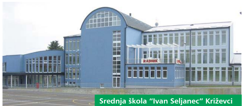
Srednja škola "Ivan Seljanec" Križevci