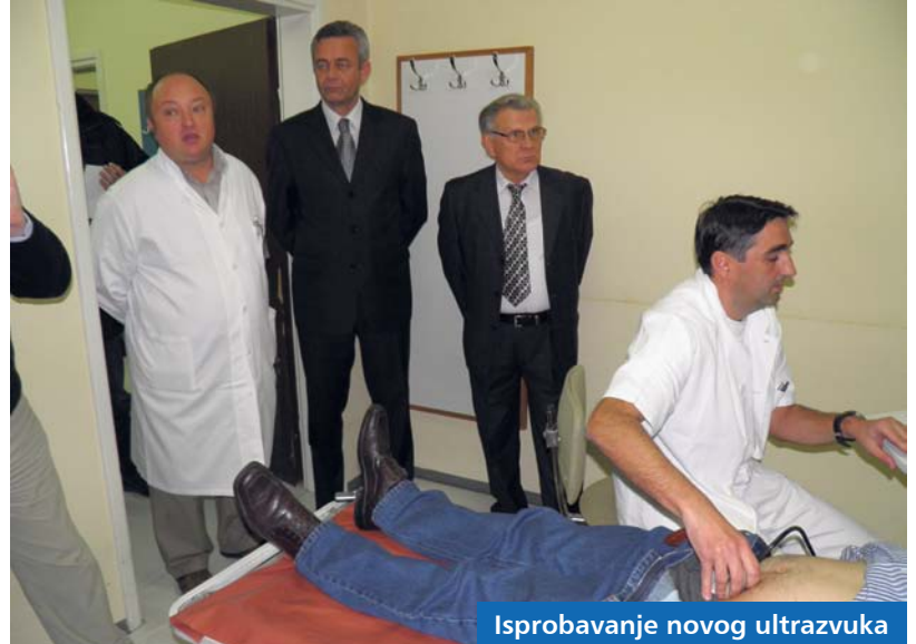
Isprobavanje novog ultrazvuka

po prvi put omogućuje da pacijenti koji trebaju ovu pretragu ne moraju putovati u Zagreb,