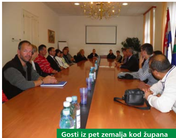
Gosti iz pet zemalja kod župana

Tijekom rujna 12 učenika i 14 nastavnika iz pet europskih zemalja boravilo je u Koprivnici na sastanku škola uključenih u projekt. Prigodom njihovog boravka u ovom kraju sudionike projekta primio je župan Darko Koren. Tijekom prijma župan je upoznat s dinamikom projekta i prvim dojmovima gostiju iz Europe. Pozvao ih je da i dalje surađuju te istaknuo da je Županija uvijek otvorena za potporu partnerstva u sličnim projektima.