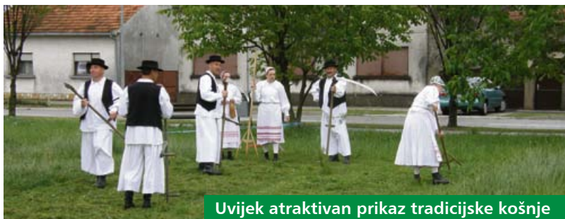
Uvijek atraktivan prikaz tradicijske košnje

Županija partner 16. Dana travnjaka bila je Virovitičko-podravska županija koju je na Sajmu predstavljao velik broj izlagača. Nakon svečanosti otvorenja između Koprivničko-križevačke županije i Hrvatske poljoprivredne agencije potpisan je Sporazum o sufinanciranju ispitivanja kvalitete stočne hrane, a predstavljena je i novooosnovana Udruga ekoloških poljoprivrednih proizvođača i potrošača Ekoplod.