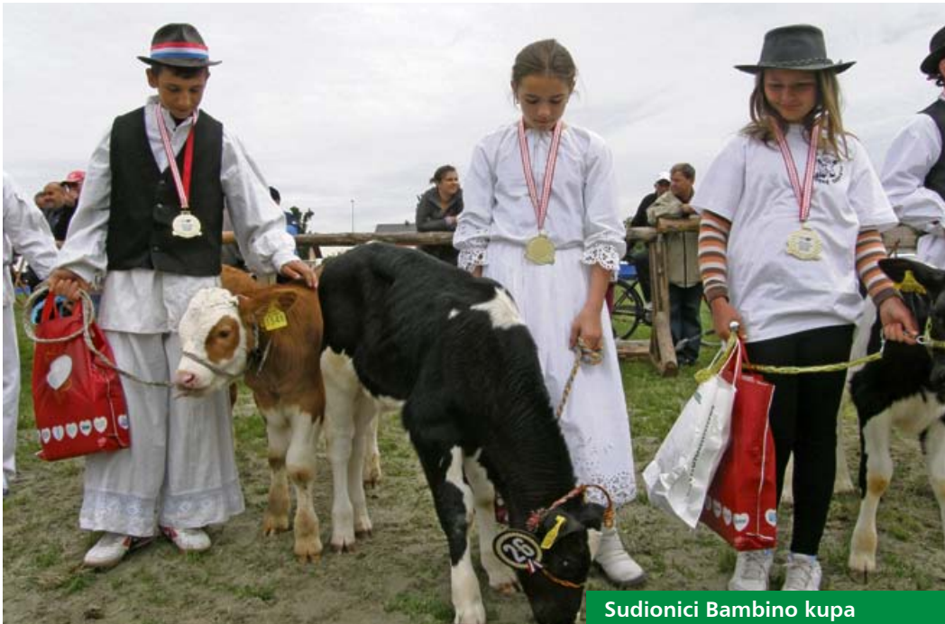
Sudionici Bambino kupa

Osim izložbeno-prodajnog dijela, manifestacija je posjetiteljima ponudila i niz drugih sadržaja. Posebno je atraktivna bila prezentacija natjecanja u oranju, kao