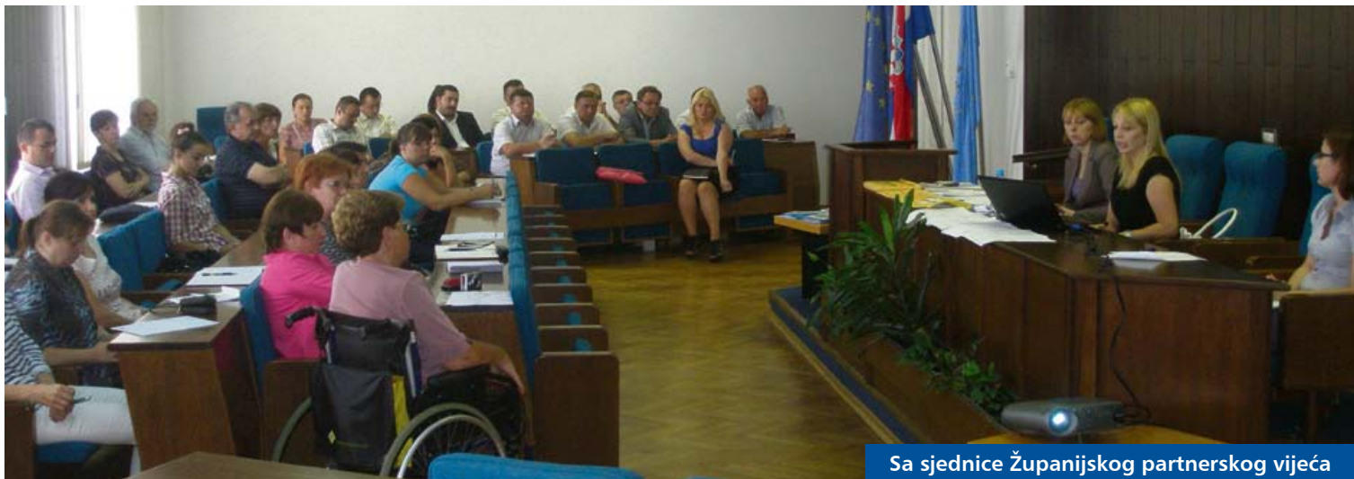
Sa sjednice Županijskog partnerskog vijeća