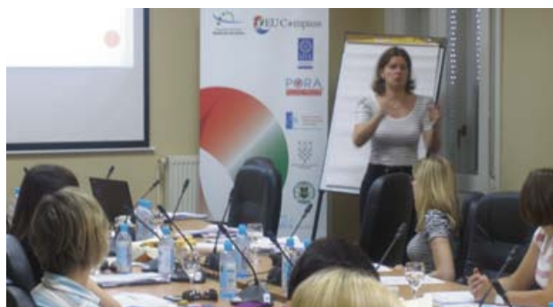
S edukacije u projektu EU Compass

U listopadu ove godine počinje provedba istraživanja inovacijskog potencijala u Koprivničko-križevačkoj i Međimurskoj županiji čiji će rezultati omogućiti izradu prijedloga za unapređenje i poboljšanje uvjeta za poduzimanje inventivnih i inovativnih projekata u poslovnom sektoru u navedenim županijama. Istraživanje provodi Ekonomski institut iz Zagreba. U okviru navedenog projekta PORA će organizirati poslovne (B2B) sastanke s ciljem povezivanja poduzetnika iz ICT sektora iz Hrvatske i Mađarske.