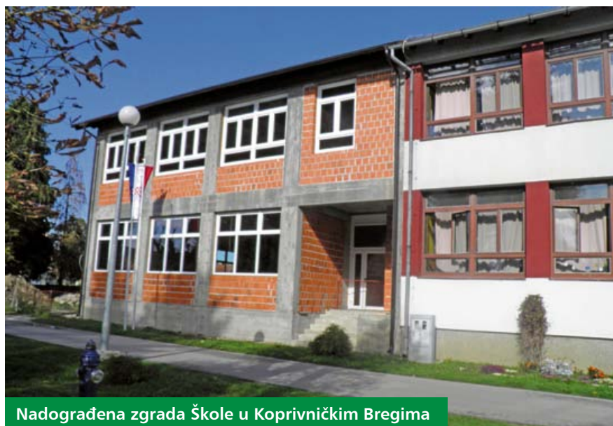
Nadograđena zgrada Škole u Koprivničkim Bregima

godine do kraja 2012. godine. Ugovorena cijena prijevoza na bazi jednog autodana za sve škole s PDV-om iznosi oko 40 tisuća kuna. Prijevoz učenika najveći je izdatak Županije u poslovanju škola. Za prijevoz 2 200 učenika županijskih osnovnih škola svakodnevno se koriste 32 autobusa spomenute tvrtke, ali i njihovih kooperanata s područja Koprivničko-križevačke županije.