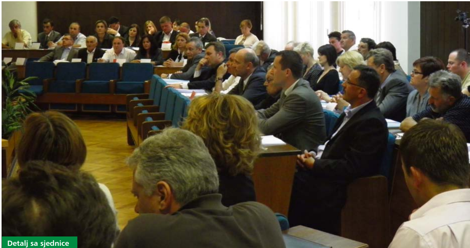
Detalj sa sjednice

Od ožujka do listopada 2012. godine održane su četiri sjednice Županijske skupštine na kojima su vijećnici raspravljali o brojnim temama iz djelokruga rada Županije. Sve četiri sjednice održane su u Gradskoj vijećnici u Koprivnici. U ovom pregledu navest ćemo najznačajnije teme o kojima su vijećnici odlučivali na ovim sjednicama.