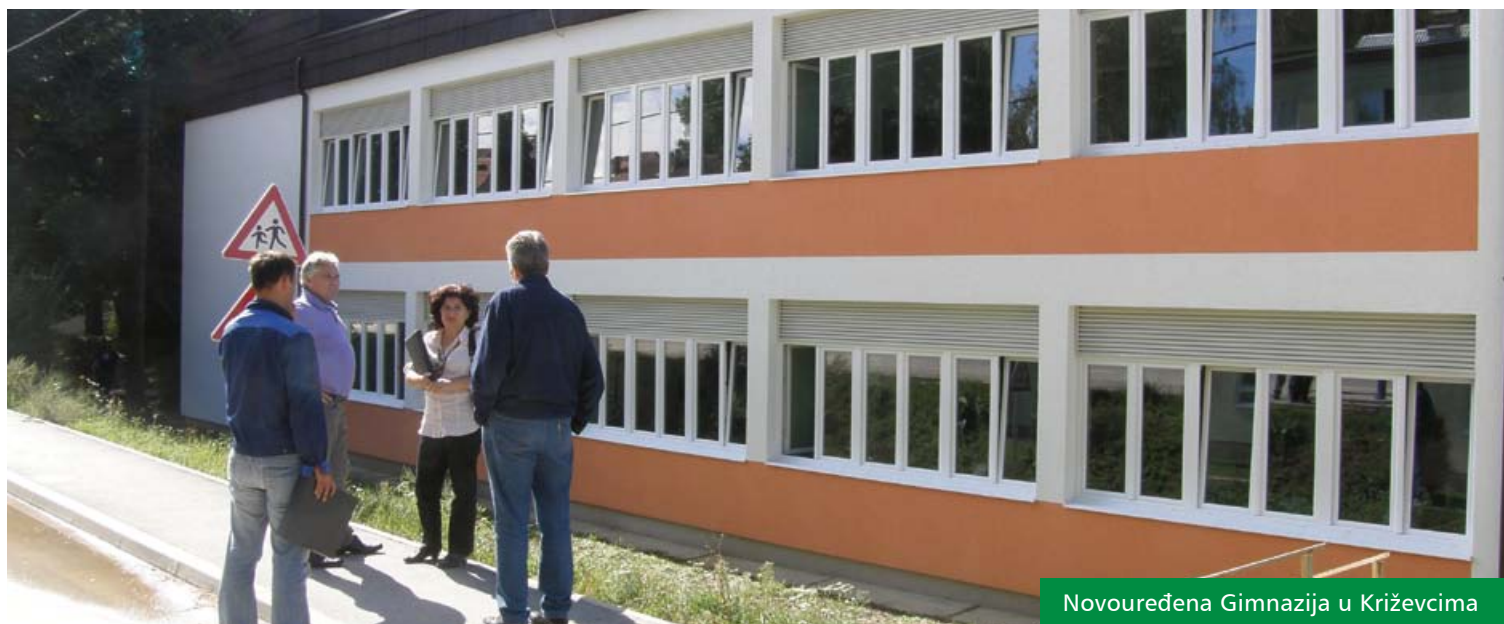
Novouređena Gimnazija u Križevcima