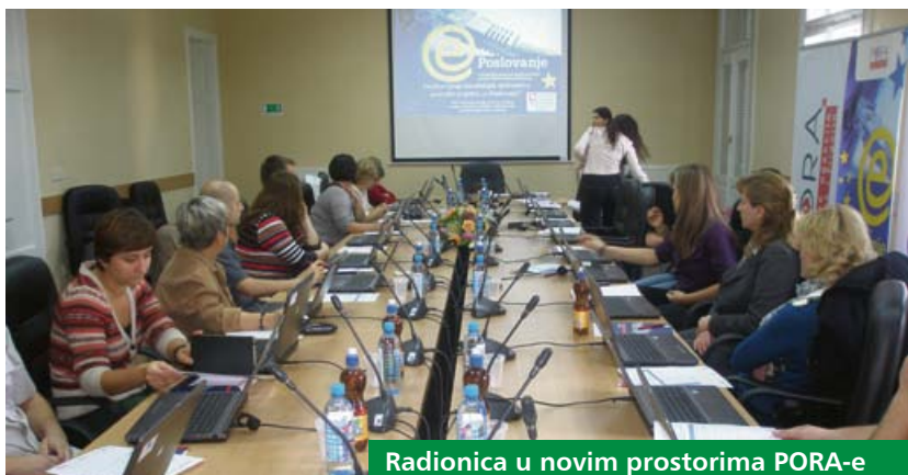
Radionica u novim prostorima PORA-e

Oprema osigurana u okviru projekta E-poslovanje poduzetnicima je omogućila samostalno izvođenje praktične vježbe na računalima kako bi ojačali svoje kapacitete za ulazak na europsko tržište.