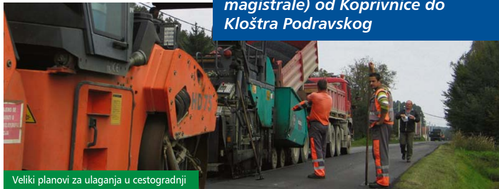
Veliki planovi za ulaganja u cestogradnju