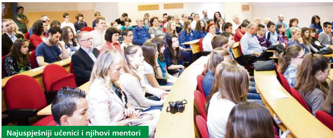
Najuspješniji učenici i njihovi mentori

Tijekom ljeta održano je nekoliko sastanaka vezanih uz nastavak radova na dogradnji Škole jer je prva faza radova zbog nepredviđenih okolnosti ostala nedovršena. U tijeku je novi natječaj za prvu fazu izgradnje „do pod krov“, za što je Županija ove godine osigurala tri milijuna kuna. Ukupna procijenjena vrijednost radova iznosi oko osam milijuna kuna, a nakon izvedene dogradnje u Školi bi se izvodila jednosmjenska nastava za više od 240 učenika. Uz to bi se izgradila i jednodijelna školska sportska dvorana ukupne površine od 1 300 četvornih metara.