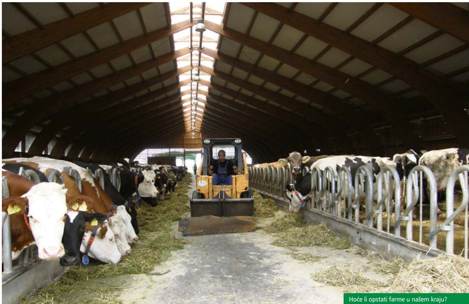
Hoće li opstati farme u našem kraju?

Istaknut je i problem nepostojanja jedinstvene dugoročne nacionalne strategije poljoprivredne proizvodnje