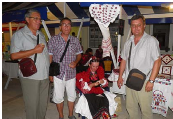
Zamjenici župana Šibensko-kninske i Koprivničko-križevačke županije u obilasku izlagača

plasman proizvoda s kontinenta tijekom turističke sezone na Jadranu, odnosno spajanje zelene i plave brazde.