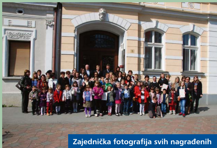
Zajednička fotografija svih nagrađenih

U sklopu projekta „Pisanica od srca“ ove godine je po treći put realiziran i program „Vuzmena košarica“ koji zajednički organiziraju Turistička zajednica i Dječji vrtić „Vrapčić“ iz Drnja, a u koji su uključena djeca dječjih vrtića i škola s područja Županije. Župan Darko Koren upričio je prijam za sve sudionike projekta „Vuzmena košarica“ i tom prilikom im je podijelio priznanja i zahvalnice za sudjelovanje. Ova akcija imala je i humanitarni karakter te su sredstva od prodaje košarica uručena Krešimiru Juratoviću, upravitelju humanitarne zaklade „Naš mali kutak raja“. Sredstva će se koristiti za adaptaciju objekata budućeg Edukativno-rekreativnog centra za djecu s teškoćama u razvoju u Komatnici. Županijska Turistička zajednica je kao nositelj organizacije izletom na Kalnik nagradila najuspješnije sudionike projekta „Vuzmena košarica“.