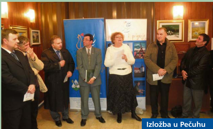
Izložba u Pečuhu