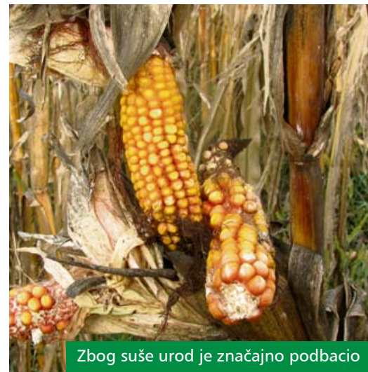
Zbog suše urod je značajno podbacio

rama, a posebno u voćarstvu, vinogradarstvu i povrtlarstvu. Krajem kolovoza župan je proglasio elementarnu nepogodu zbog šteta nastalih uslijed posljedica suše. Ove dvije nedaće značajno su smanjile prinose na poljoprivrednim kulturama te nanijele velike gubitke proizvođačima.