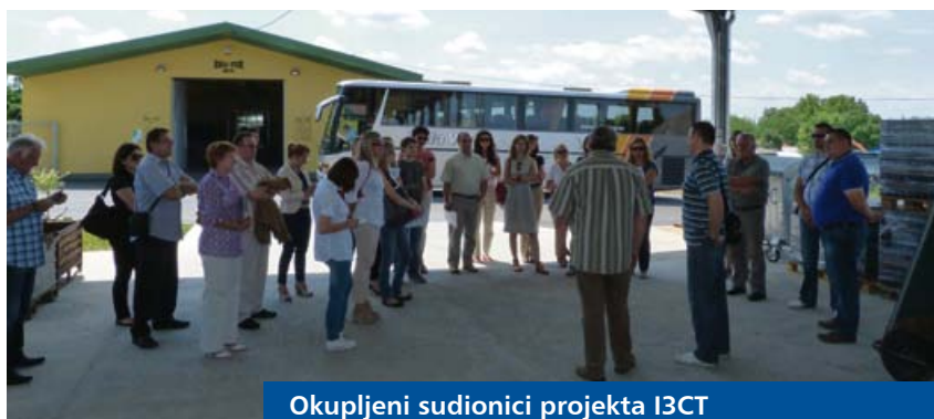
Okupljeni sudionici projekta I3CT