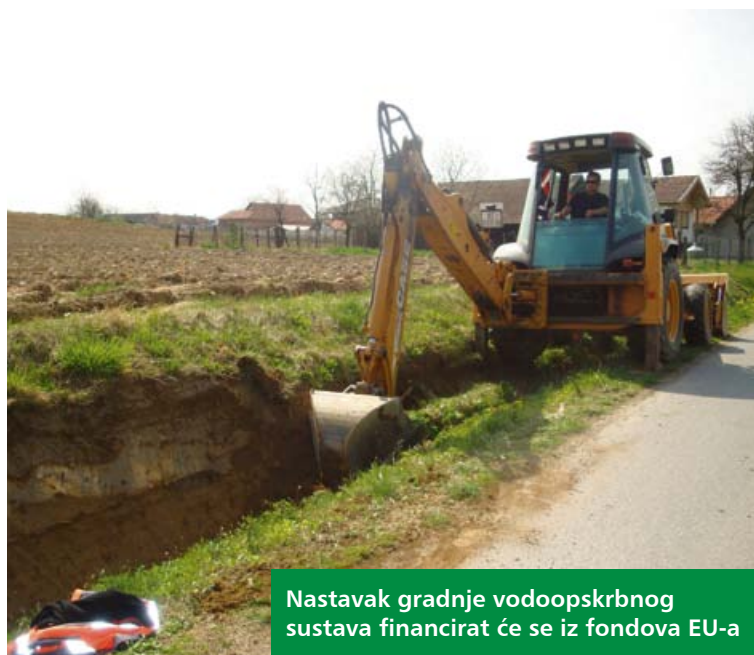
Nastavak gradnje vodoopskrbnog sustava financirat će se iz fondova EU-a

Vodoopskrbni sustav je u Podravini i Prigorju 2001. godine bio dostupan za 22 posto kućanstava, a 2012. godine taj postotak iznosi 65 posto