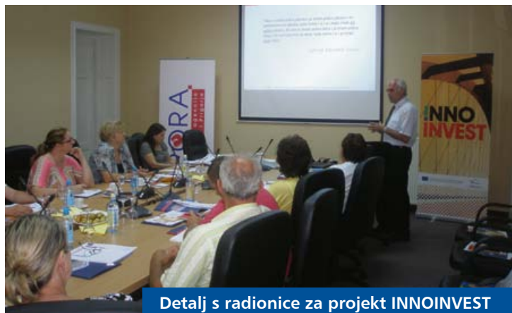
Detalj s radionice za projekt INNOINVEST

U okviru IPA Programa prekogranične suradnje Mađarska-Hrvatska 2007-2013. Razvojna agencija PORA nastavlja s provedbom triju projekata EU-a odobrenih za sufinanciranje. Riječ je o projektima INNOINVEST, EU Compass i I3CT.