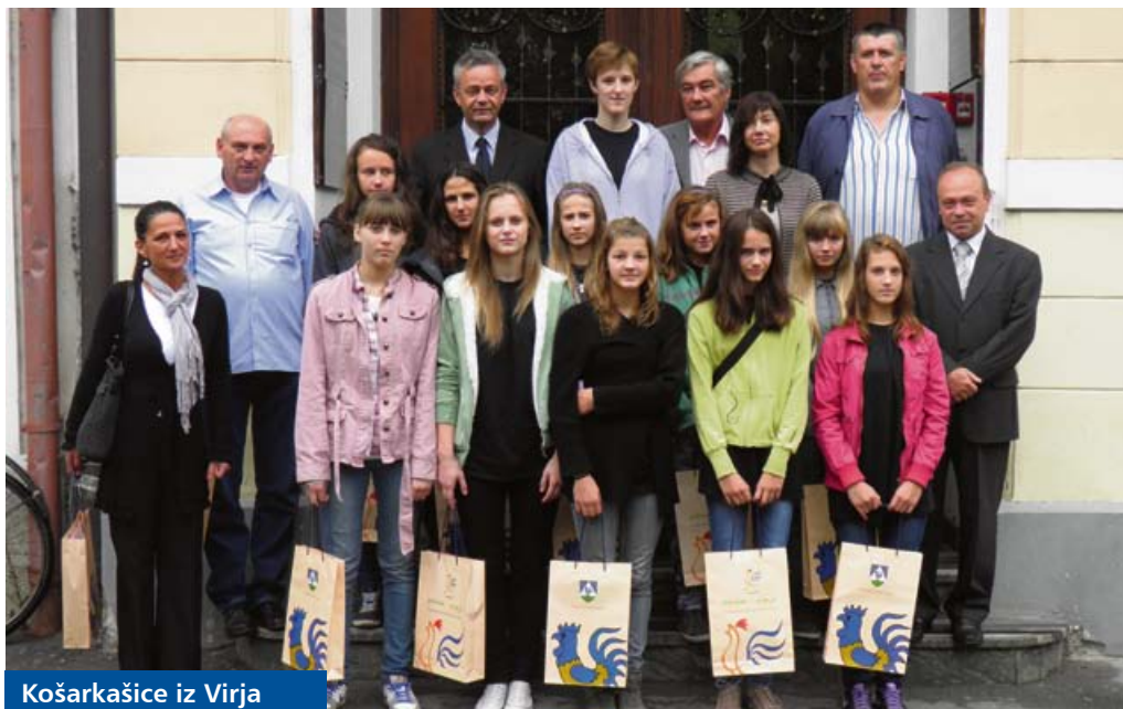
Košarkašice iz Virja

Ženska košarka u Podravini sve više napreduje, a najbolji pokazatelj tome su odlični rezultati koje postižu mlade podravske košarkašice. Košarkašice iz Drnja osvojile su prvo mjesto na završnici Prvenstva Hrvatske za osnovnoškolske ekipe tijekom svibnja u Poreču. Da ovaj uspjeh košarkašica iz Koprivničko-križevačke županije nije slučajnost, pokazale su košarkašice Podravca iz Virja koje su samo mjesec dana kasnije na Prvenstvu Hrvatske za mlade kadetkinje također postale prvakinja.