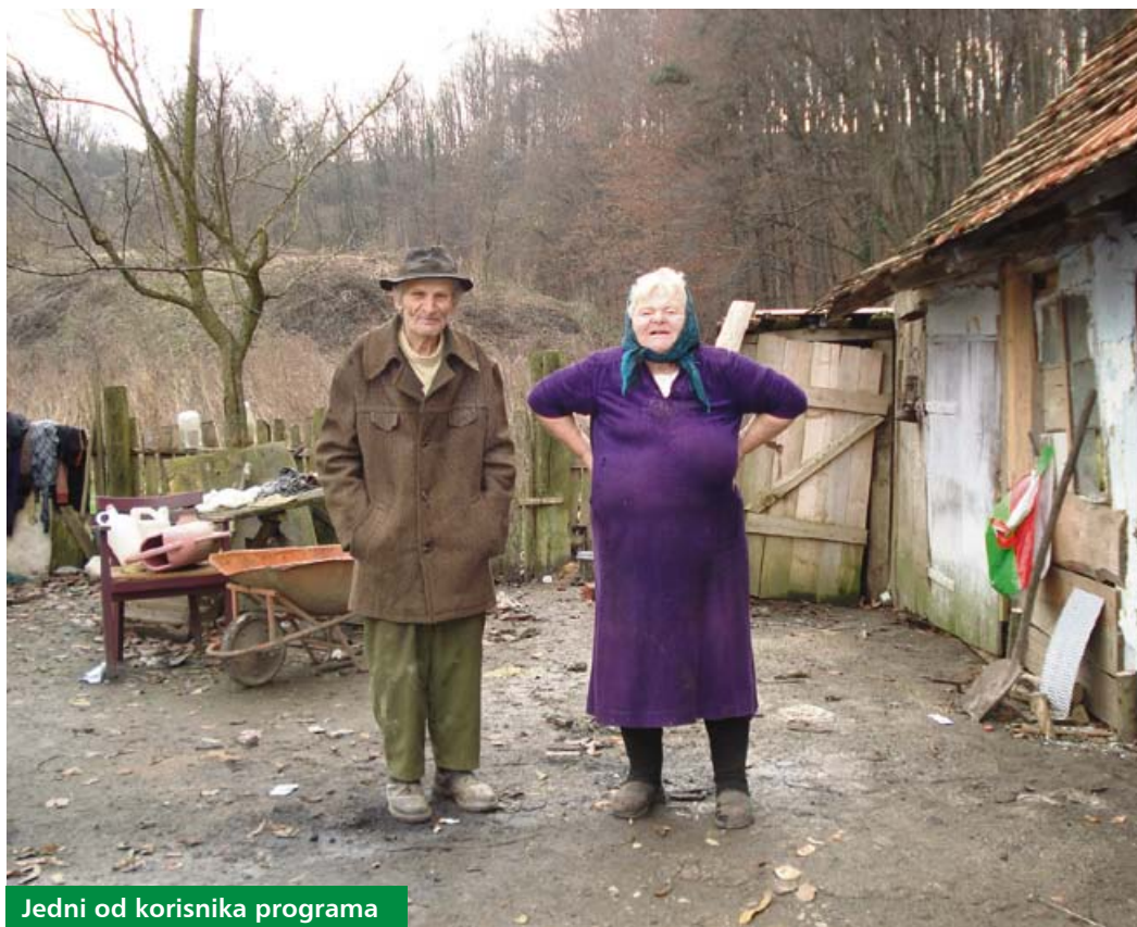
Jedni od korisnika programa

Sporazum o provođenju programa „Pomoć u kući starijim osobama“ (gerontodomaćica) za 2012. godinu 4. svibnja su u sjedištu Županije potpisali žu-