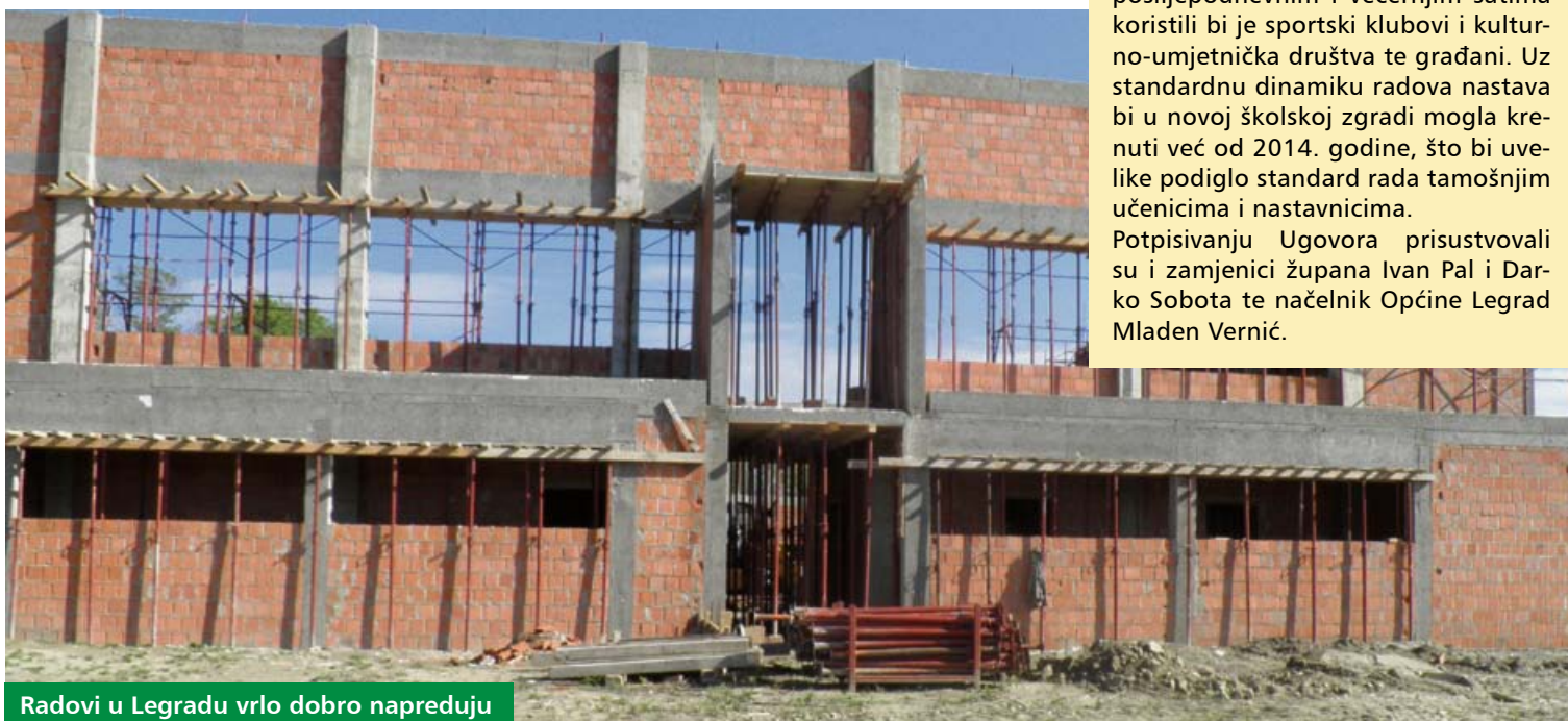
Radovi u Legradu vrlo dobro napreduju

PŠ Veliki Otok i PŠ Podravska Selnica. Škola trenutno djeluje u neadekvatnim uvjetima u staroj školskoj zgradi u dvije smjene jer ima samo četiri učionice, nema kabinete i sportsku dvoranu, a sanitarni čvor nalazi se izvan školske zgrade.