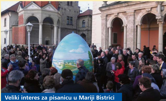
Veliki interes za pisanicu u Mariji Bistrici

Projekt županijske Turističke zajednice „Pisanica od srca“ i ove je godine značajno doprinio promociji naše Županije u Hrvatskoj i u inozemstvu. Sve je počelo izložbom pisanica u Koprivnici pa su stanovnici i posjetitelji Koprivnice mogli uživati u izložbi deset velikih i dvije male „pisanice od srca“. Jedna je pisanica poklonjena predsjedniku Republike Hrvatske Ivi Josipoviću, a zatim sa redom postavljene u Beču na starom gradskom trgu Freyung, na platou ispred crkve u Mariji Bistrici te u Riversideu kod Los Angelesa u SAD-u. U suradnji s općinom Kalinovac slikari su oslikavali pisanicu u Balatonboglaru u Mađarskoj, a druga pisanica iz Kalinovca postavljena je u općini Bogdanci u Makedoniji. Zahvaljujući suradnji županijske Turističke zajednice i Grada Koprivnice naši umjetnici su oslikavali pisanicu u Nikšiću (Crna Gora).