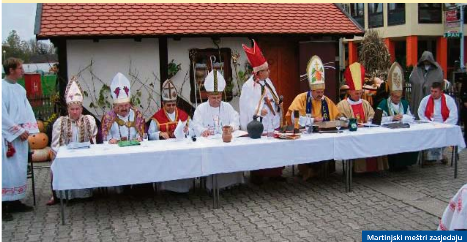
Martinjski meštari zasjedaju

i Bjelovarsko-bilogorske županije, Udruga vinara „Žlahtina“ iz Vrbnika s otoka Krka, a očekuje se dolazak i drugih turističkih zajednica i vinara. Županijska Turistička zajednica organizira i studijsko putovanje za novinare i predstavnike putničkih agencija koji će prisustvovati špelanciji, ali i obići Koprivničko-križevačku županiju i upoznati se s njezinim turističkim potencijalima.