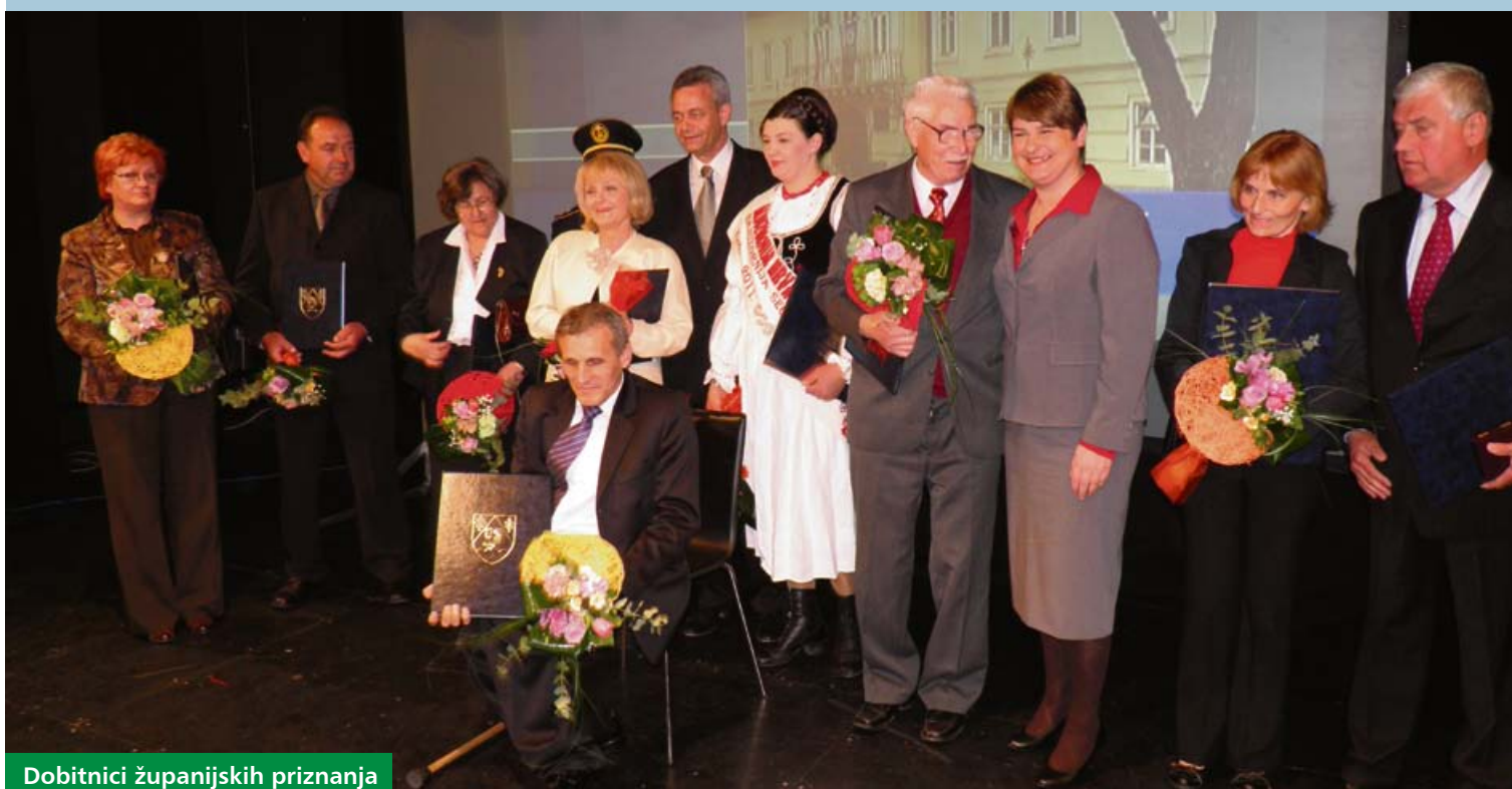
Dobitnici županijskih priznanja