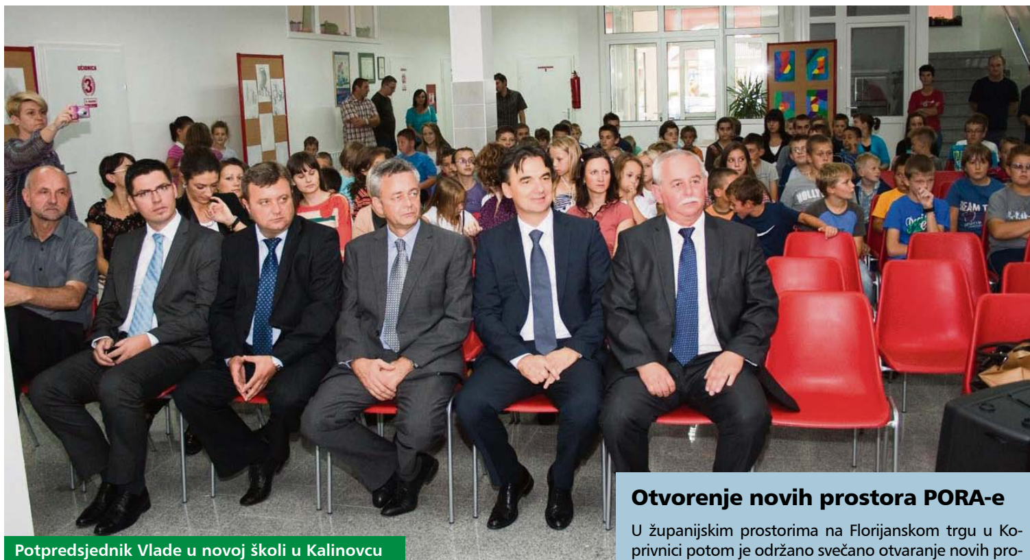
Potpredsjednik Vlade u novoj školi u Kalinovcu

Predstavljena su dva najznačajnija županijska projekta: projekt vodoopskrbe i odvodnje i projekt Regionalnog centra za gospodarenje otpadom Piškornica