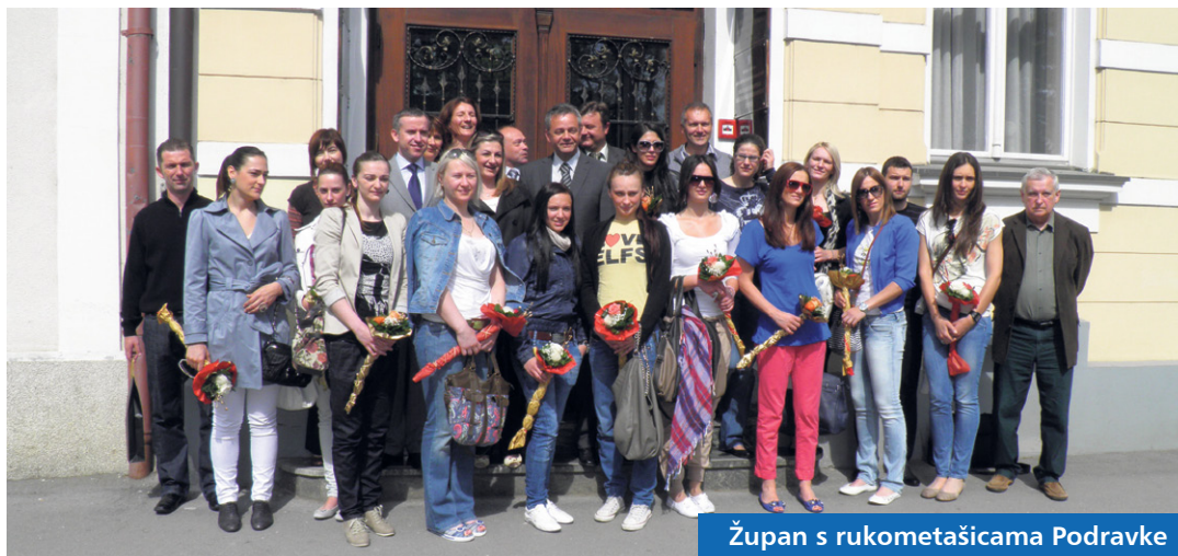
Župan s rukometašicama Podravke

Rukometašice Podravke ukupno su u svojoj povijesti osvojile 41 trofej, a osim ostvarenja u Hrvatskoj, tu su i dva osvojena prvenstva bivše Jugoslavije, po jedan naslov u regionalnoj ligi i interligi te naslov prvakinja Europe i Europski superkup. Prema osvojenim trofejima, Podravka je najtrofejniji ženski sportski klub u Hrvatskoj. Ove sezone Podravka Vegeta je ponovno osvojila dvostruku krunu - 17. put KUP Hrvatske i 18. naslov hrvatskih prvakinja, što je i bio povod ovom susretu u Županiji.