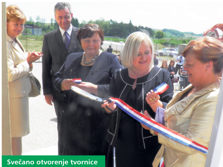
Svečano otvorenje tvornice

Punim kapacitetom radi jedna linija šivača, postupno počinje s radom i druga, a uskoro bi se pogon trebao proširiti, nakon čega bi u tvornici radilo 75 djelatnika