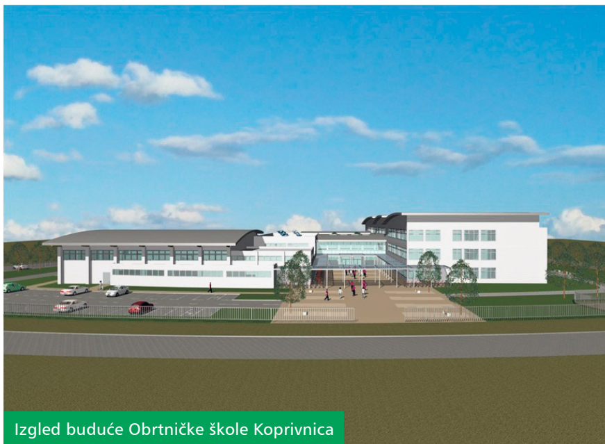
Izgled buduće Obrtničke škole Koprivnica

Škola je projektirana za rad u jednoj smjeni za 700 učenika koji se obrazuju za tehnička i obrtnička zanimanja. Sastoji se od nekoliko funkcionalnih cjelina: klasičnih i specijaliziranih učionica, praktikuma i radionica, školske sportske dvorane, gospodarskih sadržaja, vanjskih sportskih terena i ostalih pratećih prostora. Ukupna bruto površina škole je 11.695 četvornih metara, a građevinsku parcelu je osigurao Grad Koprivnica.