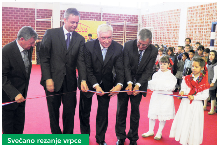
Svečano rezanje vrpce

Projekt gradnje i opremanja nove sportske dvorane iznosio je 10,8 milijuna kuna, od čega je Županija izdvojila 9,3 milijuna kuna, a Grad 1,5 milijuna kuna