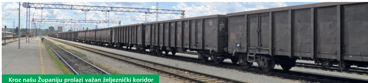
Kroz našu Županiju prolazi važan željeznički koridor

rope unaprjeđivati CETC-ROUTE 65 inicijativu povezujući je s europskim prometnim sustavom te inicirati i podupirati zajedničke inicijative koje jačaju gospodarski razvoj uzduž predviđene rute. Uključivanjem u ovu inicijativu očekuju se veće mogućnosti za iskorištavanje fondova europske unije kako bi se modernizirala postojeća infrastruktura na koridoru.