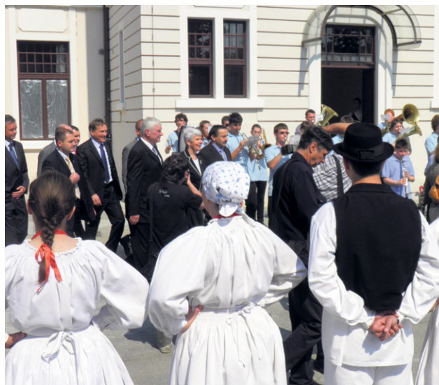
Premijerka u Koprivnici prilikom otvorenja radova