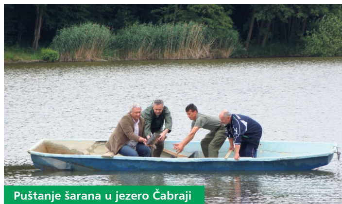
Puštanje šarana u jezero Čabraji

U svako jezero puštene su po tri ribe, a ribolovac koji uhvati neku od njih može otići kući bogatiji za pet tisuća, tri tisuće ili dvije tisuće kuna