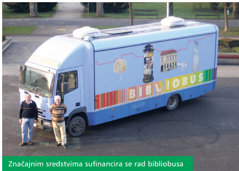
Značajnim sredstvima sufinancira se rad bibliobusa

Po okončanju ovogodišnjeg natječajnog postupka za programe u kulturi župan Darko Koren donio je zaključak o rasporedu sredstava županijskog Proračuna. Za sufinanciranje zaštite spomenika kulture i sakralnih objekata raspoređeno je 555 tisuća kuna, od čega 410 tisuća za obnovu crkvenih objekata diljem Županije.