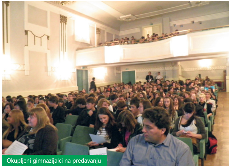
Okupljeni gimnazijalci na predavanju

U organizaciji Županijskog savjeta mladih Koprivničko-križevačke županije 18. svibnja je u koprivničkom Domoljubu održano predavanje „Mladi na putu u Europsku uniju“. Predavanje je organizirano za učenike trećih razreda gimnazija s područja Županije koji su uoči dolaska u Domoljub posjetili i tvrtku Podravka.