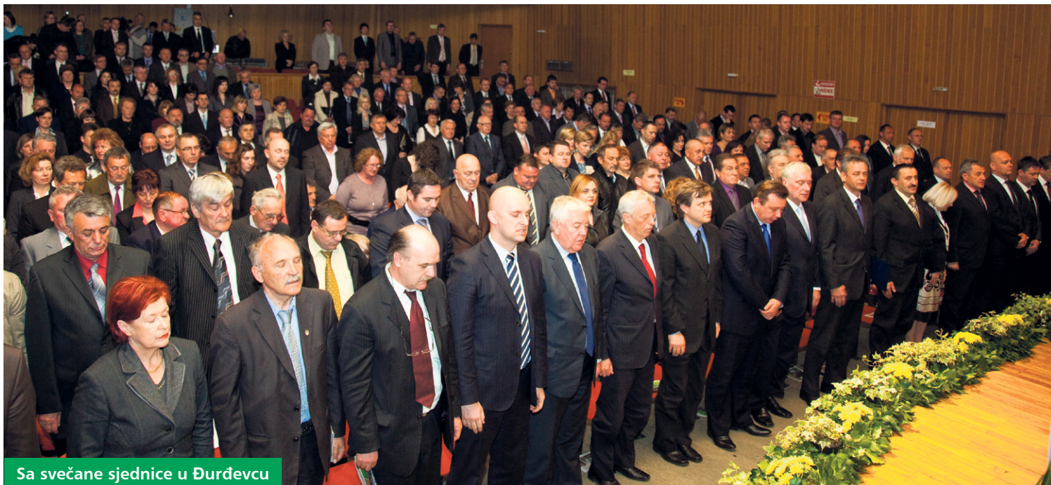
Sa svečane sjednice u Đurđevcu

Govoru župana Darka Korena prethodio je film o investicijama u proteklih godinu dana u kojem su prikazane sve kapitalne investicije u školstvu i zdravstvu