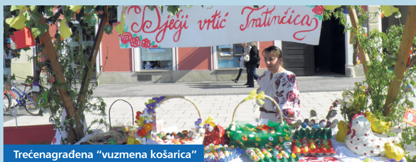
Trećenagrađena "vuzmena košarica"