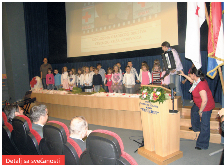
Detalj sa svečanosti

Koprivničko društvo je pohvaljeno kao jedno od najaktivnijih u zemlji i drugo je u Hrvatskoj koje je primilo ovo visoko priznanje