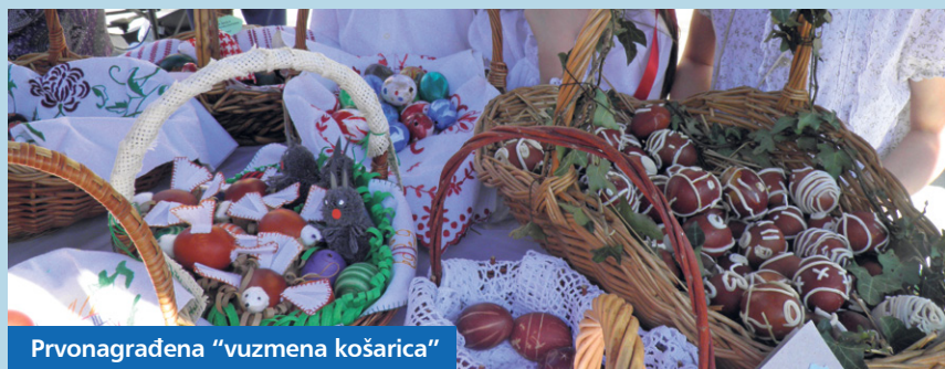
Prvonagrađena "vuzmena košarica"

Sudionike projekta "Vuzmena košarica" je 27. travnja primio župan Darko Koren te je djeci tom prigodom uručio priznanja i čestitao im za njihov trud. Dječje radove u sklopu projekta je ocjenjivalo stručno povjerenstvo koje je donijelo odluku da su ove godine najljepšu „vuzmenu košaricu“ imali učenici OŠ Grgura Karlovcana iz Đurđevca, drugo mjesto osvojio je Dječji vrtić „Fijolica“ iz Novigrada Podravskog, a treće skupina Vjeverica iz koprivničkog Dječjeg vrtića „Tratinčica“. Ostali sudionici primili su prigodna priznanja za sudjelovanje.