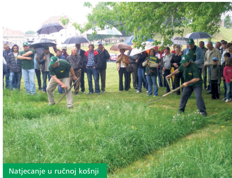
Natjecanje u ručnoj košnji

U sklopu manifestacije održan je okrugli stol na temu Osnivanje Lokalnih akcijskih grupa - LAG-