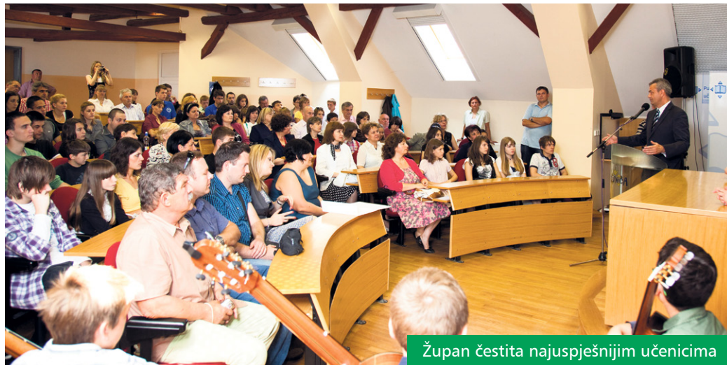
Župan čestita najuspješnijim učenicima

Desetero učenika primilo je nagradu od dvije tisuće kuna za osvojeno prvo mjesto u pojedinačnoj kategoriji, drugo mjesto osvojilo je 14 učenika, a treće mjesto njih