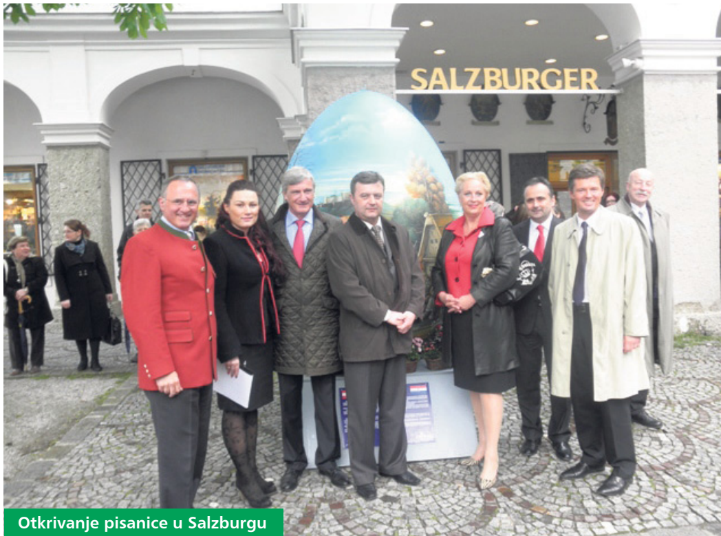
Otkrivanje pisanice u Salzburgu

Pisanica je ove godine postavljena u Bruxellesu, Pragu, Zagrebu, Salzburgu, Grazu, Pecu, Ptuju, Čitluku, Međugorju, Batrini i Koprivnici