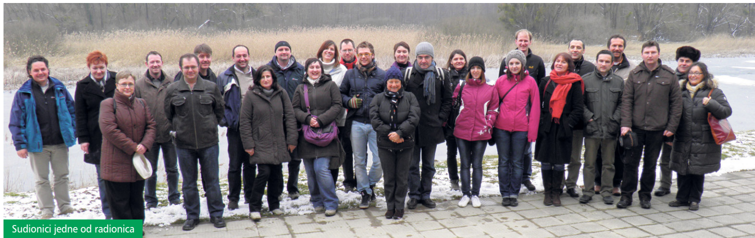
Sudionici jedne od radionica

Ovaj projekt odvija se u sklopu Transnacionalnog programa za jugoistočnu Europu (SEE) i financiran je iz sredstava Europskog regionalnog razvojnog fonda (ERDF) Europske unije