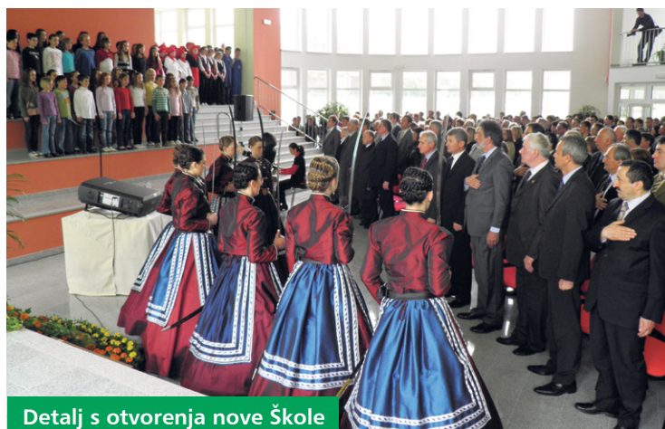
Detalj s otvorenja nove škole

Koprivničko-križevačke županije i Grada Križevaca te Fonda za zaštitu okoliša i energetske učinkovitost.