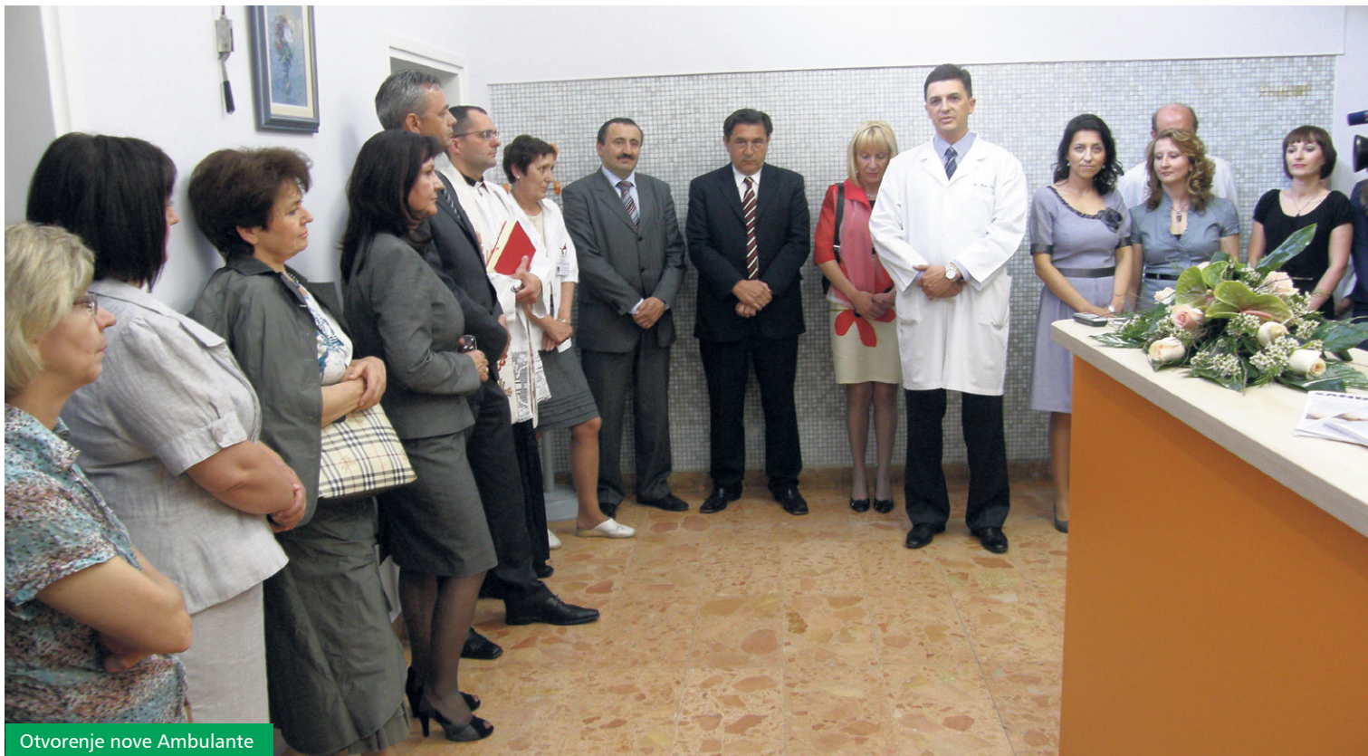
Otvorenje nove Ambulante

Cilj je da se palijativnim bolesnicima osigura skrb sukladno standardima razvijenih zemalja