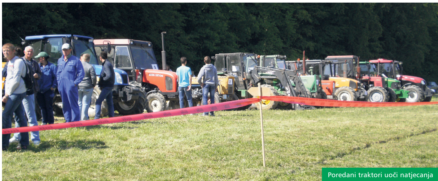
Poredani traktori uoči natjecanja