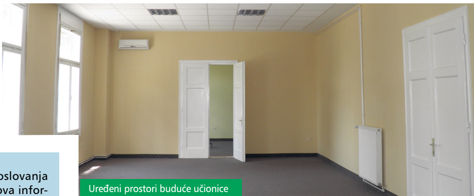
Uređeni prostori buduće učionice

deni prostori se obnavljaju kako bi se u njih smjestile županijske službe i ustanove, a predviđeno je da se u tim prostorima smjesti i informatička učionica za poduzetnike.