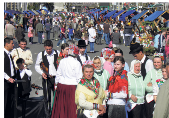
Tradicija naših starih na Zrinskom trgu u Koprivnici

i tradicionalne podravsko-prigorske gastronomske i enološke ponude. Na štandovima se predstavilo tridesetak izlagača iz svih krajeva Podravine i Prigorja. U organizaciji županijske Turističke zajednice tom je prigodom održana i prodajna izložba uskrasnih pisanica. Pisanice su u sklopu projekta „Vuzmena košarica“ oslikavala djeca iz deset dječjih vrtića i tri osnovne škole, a sredstva od prodaje pisanica uplaćena su u dobrotvorne svrhe.