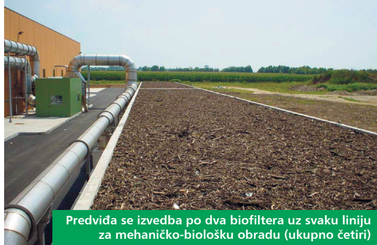
Predviđa se izvedba po dva biofiltera uz svaku liniju za mehaničko-biološku obradu (ukupno četiri)