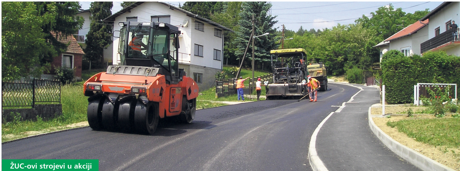
ŽUC-ovi strojevi u akciji

Lanjski prihodi utrošeni su za radove redovnog održavanja cesta, ali i za obnovu kolnika na 16 različitih dionica u dužini od preko deset kilometara