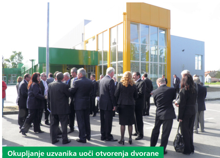
Okupljanje uzvanika uoči otvorenja dvorane