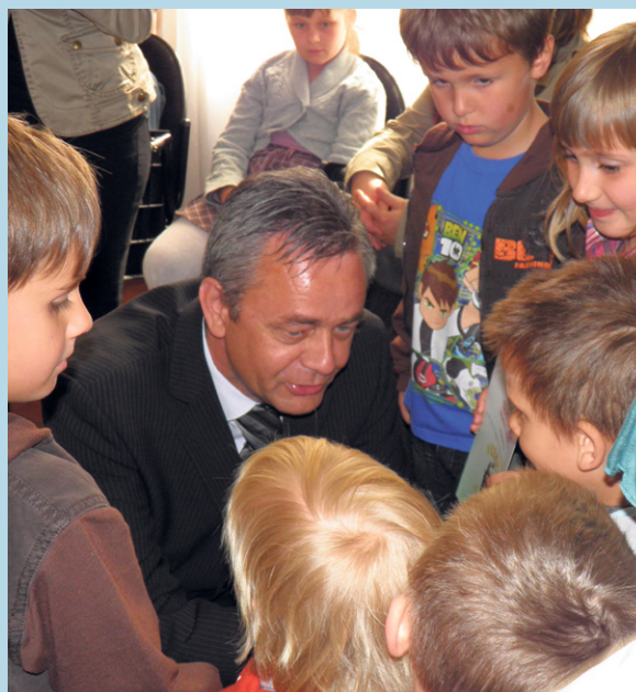
Župan s najmlađim sudionicima "Vuzmene košarice"