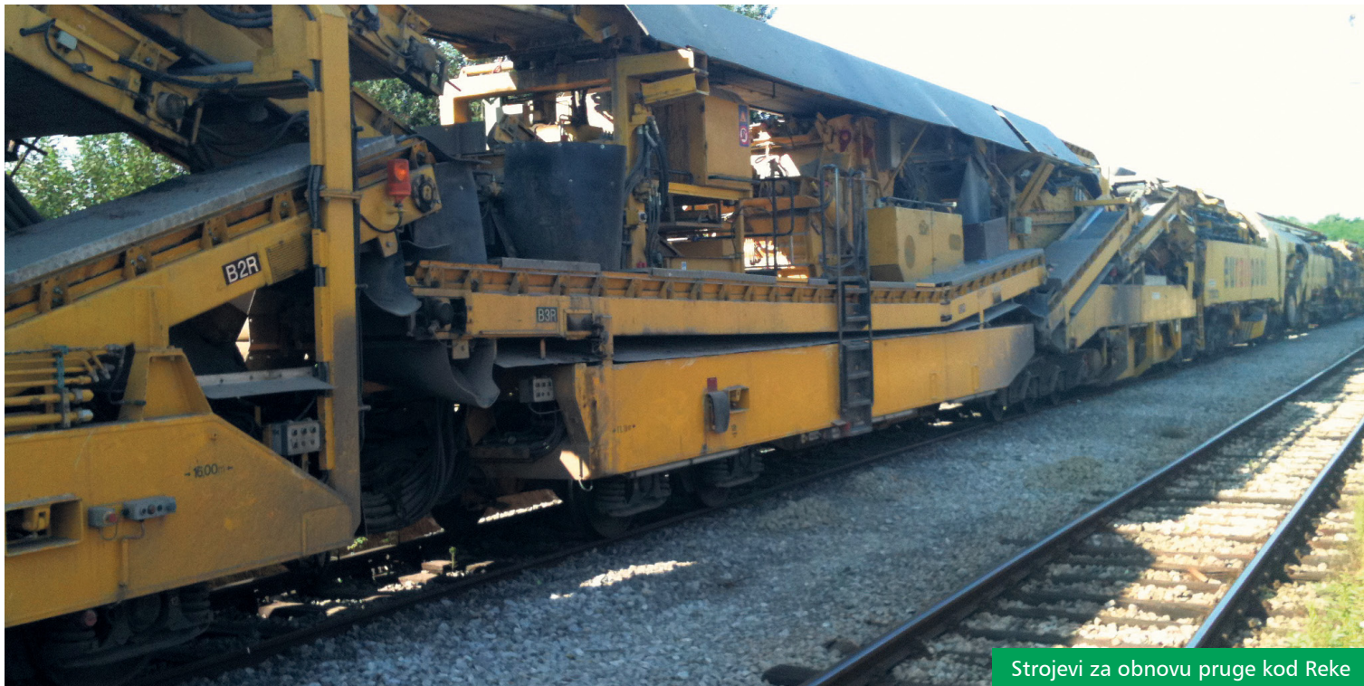
Strojevi za obnovu pruge kod Reke

Kada radovi budu gotovi, vlakovi će moći voziti brzinom 140 kilometara na sat i vožnja od Koprivnice do Zagreba trajat će oko 50 minuta