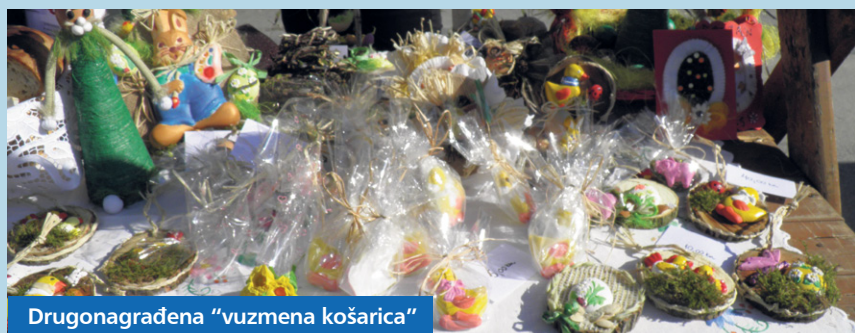
Drugonagrađena "vuzmena košarica"