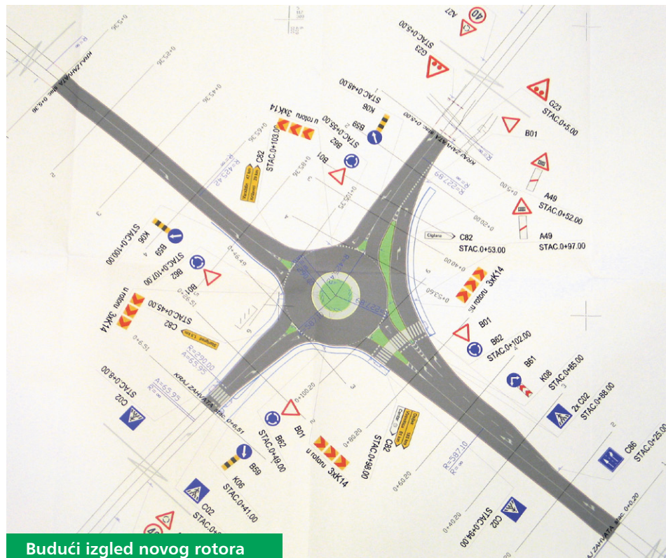
Budući izgled novog rotora

Kompletna investicija gradnje, sa zaštitom instalacija i PDV-om, iznosit će oko dva milijuna kuna. Radovi će trajati oko 60 dana, a novi kružni tok trebao bi biti stavljen u funkciju ove jeseni.