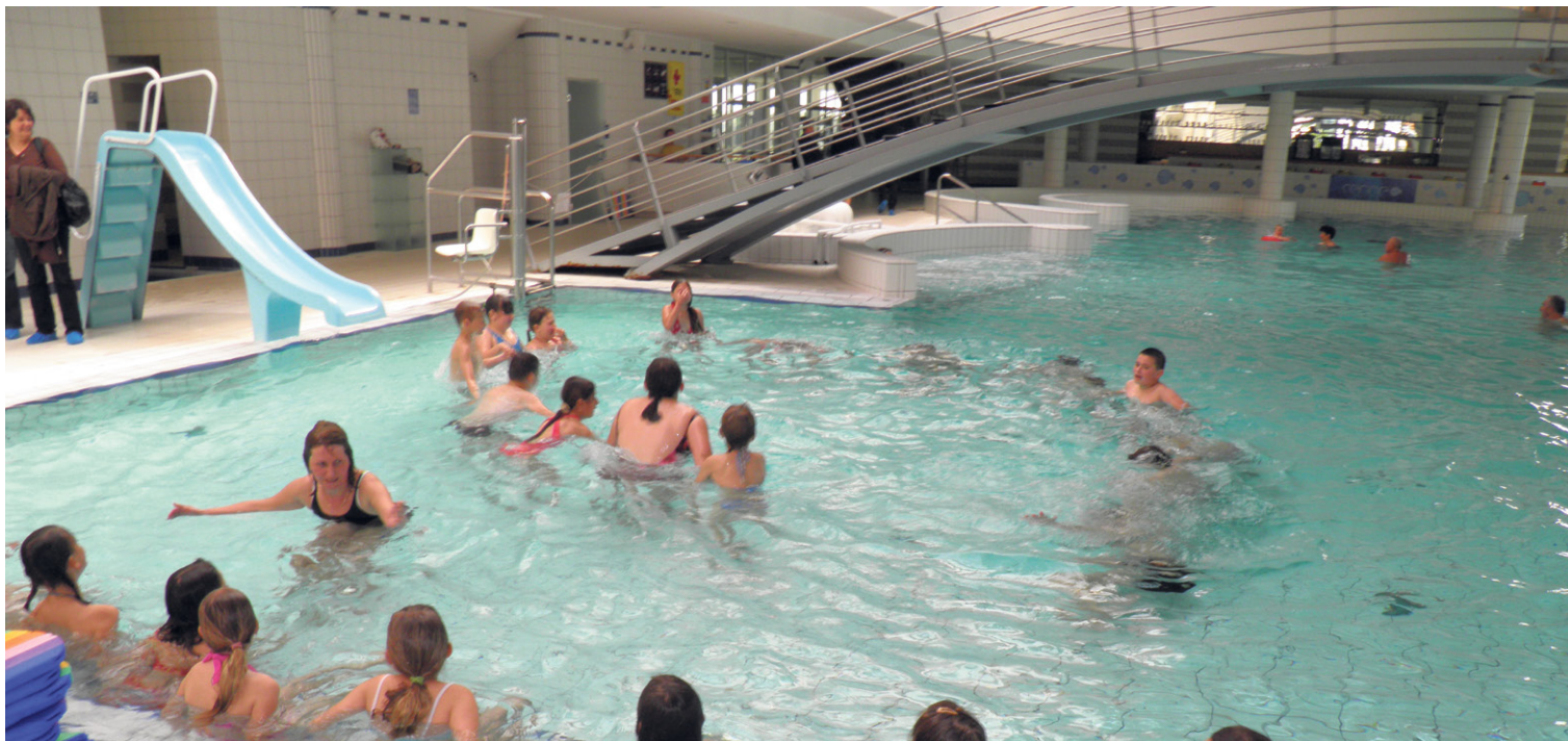
Škola plivanja na bazenima „Cerine“