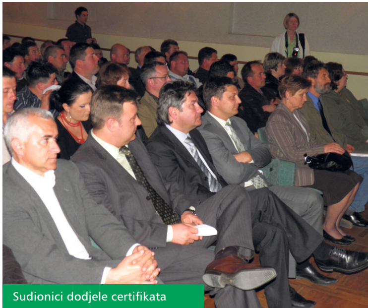
Sudionici dodjele certifikata

U organizaciji Pučkog otvorenog učilišta Koprivnica, Koprivničko-križevačke županije i poljoprivrednih udruga s područja Županije ove zime provodila se edukacija poljoprivrednika pod nazivom „Mala poljoprivredna akademija“. Edukacija se provodila s ciljem da poljoprivrednici unaprijede